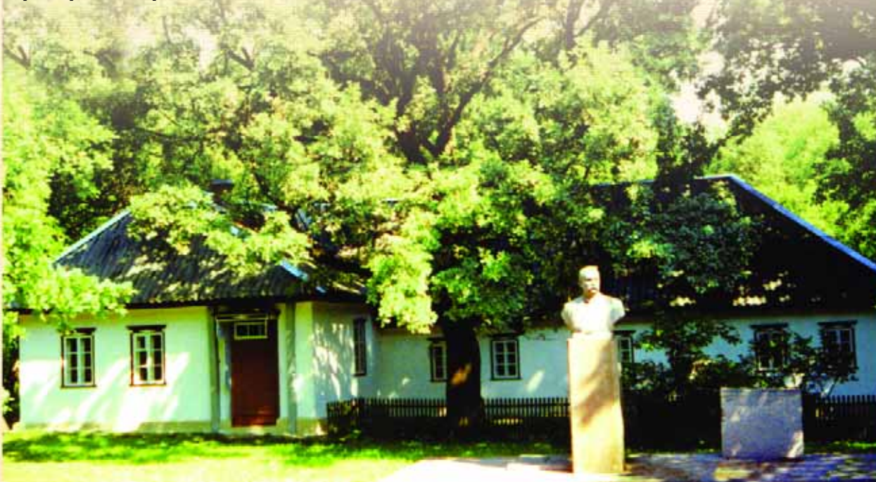
Заповідник-музей І.К. Карпенка-Карого (Тобілевича) “Хутір Надія”. Кіровоградський район, с. Миколаївка