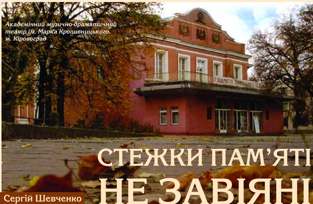
Академічний музично-драматичний театр ім. Марка Кропивницького. м. Кіровоград