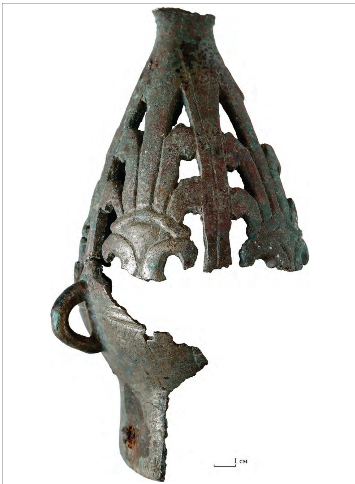
Рис. 4. Фрагмент навершя з Гайманової Могили (Арх-1020)

Цей екземпляр був знайдений в уламках. У колекцію Запорізького обласного краєзнавчого музею надійшли лише два фрагменти грушо-