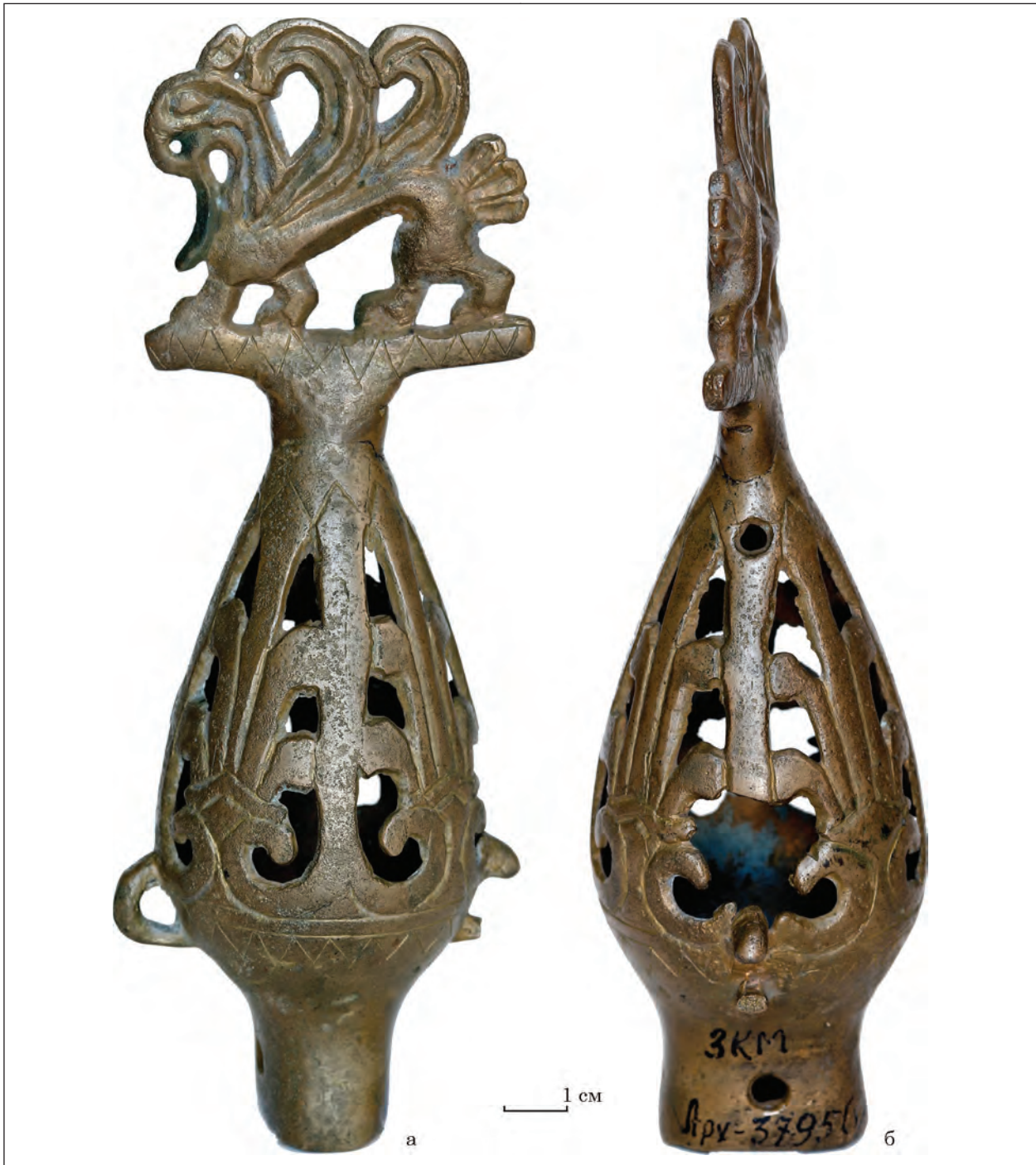
Рис. 3. Навершя з Чмиревої Могили (Арх-3795/1)

на довгих сторонах втулки, мають розміри 0,5 і 0,4 см. Перекладаина разом з грифоном має довжину 6,0 см, висоту 0,7 см, ширину 0,2 см. Висота самого грифона — 4,8 см. Фігурка грифона майже ідентична № 1. Є невелика різниця в оформленні деяких деталей: на задній лапі немає гострого виступу, вухо вужче, око більш витягнуте. Розділяє візерунки на тулубі гладка смуга. Збереженість виробу трохи гірша: одна петля, разом з вертикальною розділювальною смугою, що розташована знизу, обламана. У верхній частині бубонця, над отворами, що роз-