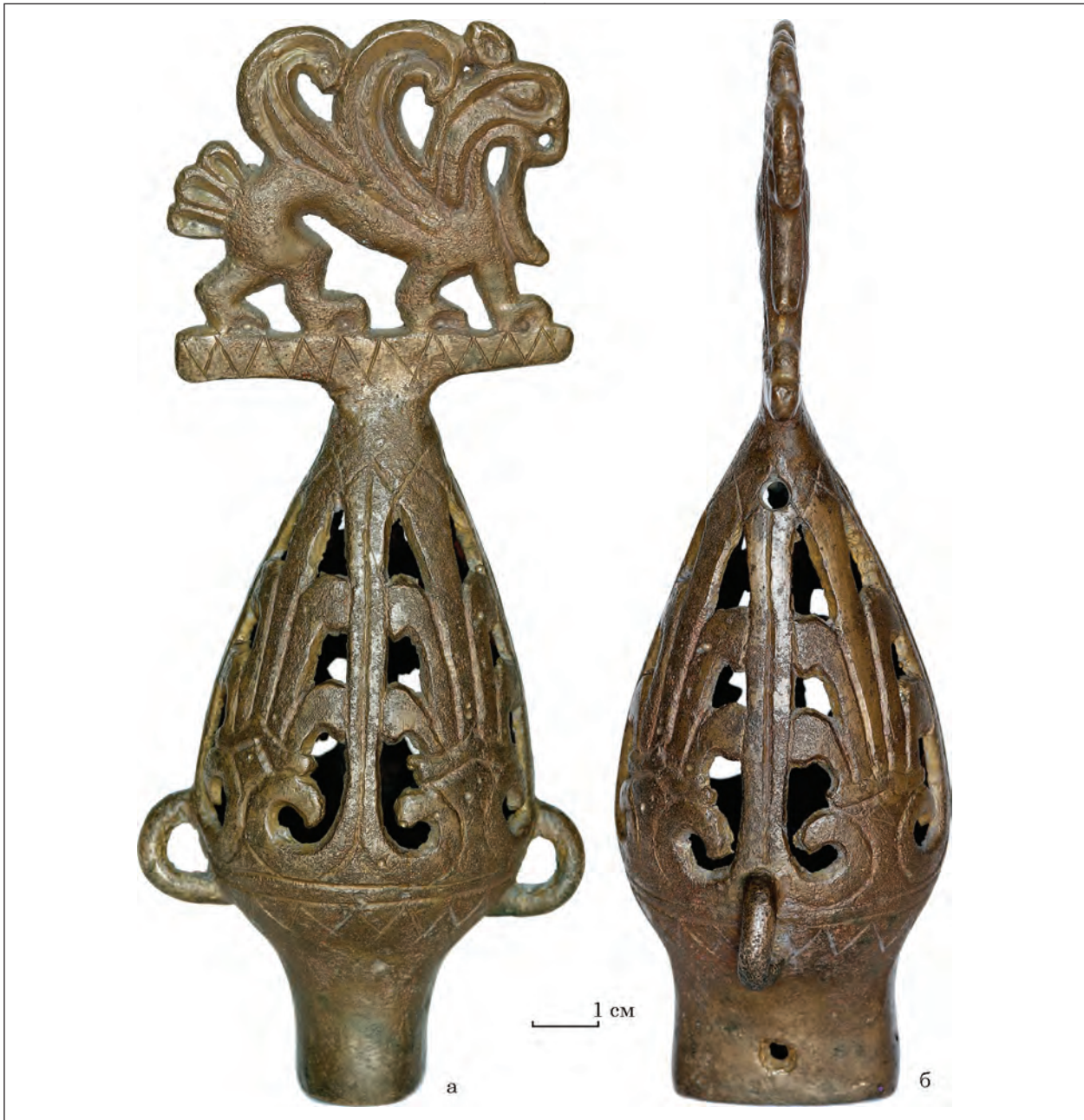
Рис. 1. Навершя з Чмиревої Могили (Арх-3795/3)

леними смугами. Усередині кожної з частин розміщений візерунок у вигляді витягнутої вгору п'ятипелюсткової пальметки. Нижня частина «груші» обмежена двома врізаними концентричними лініями, від яких опускаються врізані трикутники вершинами донизу, утворюючи зигзагоподібний візерунок. Такий же орнамент з ламаних ліній обмежує верхню частину «груші». Тут, по тій лінії, що і петлі, розташовані, навпроти один одному, два круглих отвори діаметром 0,4 см. В одній частині візерунка, поруч з отвором, виділяється хресто-подібна фігура.