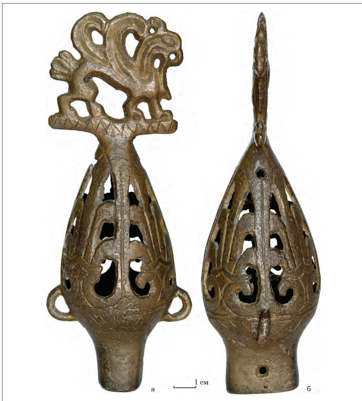
Рис. 2. Навершя з Чмиревої Могили (Арх-3795/2)

Навершя 2. Друге навершя, під номером ЗКМ-Арх-3795 (2), має висоту 17,3 см, найбільший діаметр бубонця — 5,5 см. Розміри поперечини, на якій стоїть грифон, складають 6,0 × 0,6 × 0,3 см. Висота самої фігурки — 4,7 см. Втулка прямокутна, по краю сплюснена, внутрішній розмір — 2,8 × 1,6 см, зовнішні — 3,3 × 2,0 см. Внизу, по довгій стороні втулки, пробиті два круглих протилежних отвори, діаметрами 0,3 і 0,4 см. На одній з вузьких сторін є дугастий наскрізний отвір. Призначення його незрозуміле — чи то брак лиття, чи помилка розмітки отворів (?).