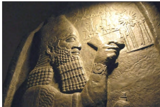
Рис. 1. Царь Асархаддон. Стела о завоевании Египта (Самаль). Берлин. Государственные музеи

и Мадия сопоставляют с курганами Краснознаменского (Петренко. 2006) и Келермесского могильников Северного Кавказа (Галанина 1997, с. 180; Алексеев 2003, с. 103—107).