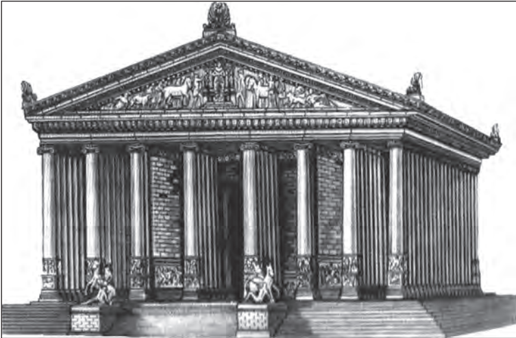
Рис. 6. Храм Артемиды в Эфесе (Антонова 2008)

оружавшихся, по мнению исследователей, на протяжении 200—150 лет.