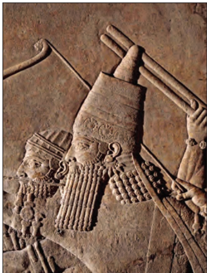
Рис. 5. Царь Ашшурбанапал. Рельеф из его дворца (помещение С) в Ниневии (Barnett 1959)

скифских походов в Переднюю Азию (Петренко 2006, с. 109—112).