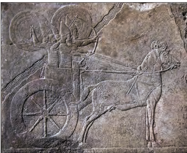
Рис. 8. Ассирийская колесница. Рельеф из Ниневии, VII в. до н. э. Пергамский музей

голюден и сила у тебя велика... ты изгонишь Хананеев, хотя у них колесницы железные, и хотя они сильны, [ты одолеешь их]» (Нав. 17: 17—18), и Книга Судей, из которой следует, что Иуда, после смерти Иисуса возглавивший сынов Израилевых (I, 1—2), не мог прогнать жителей долины, потому что у них были железные колесницы (I, 19) 1 .