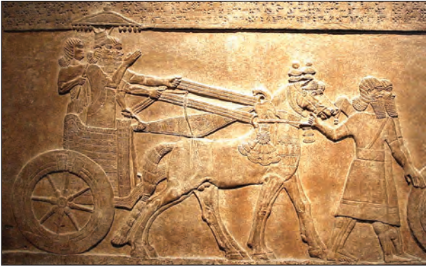
Рис. 7. Ассирийская колесница. Рельеф из Центрального дворца в Кальху (Нимруд), VIII в. до н. э. Британский музей