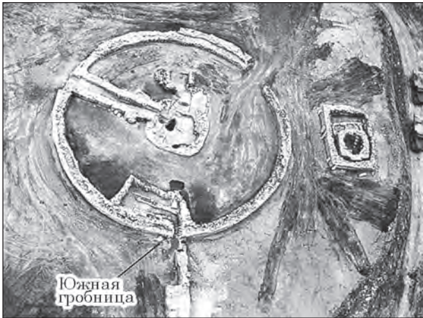
Рис. 3. Краснознаменский могильник. Общий вид погребальных сооружений кургана 1 (Петренко 2006)

погребальном обряде, связывается исследователем с захоронениями дружинников и людей, близких царствующему дому (Петренко 2006, с. 109—112).