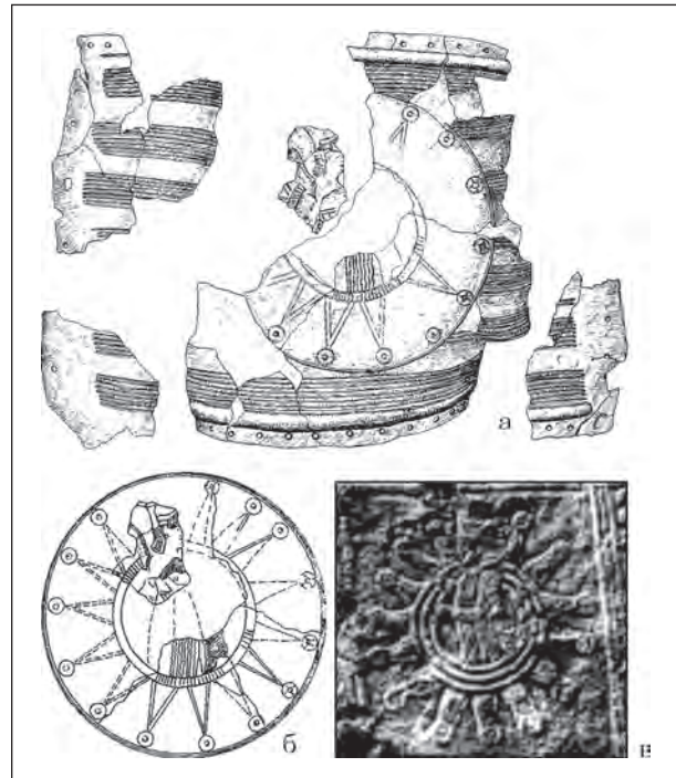
Рис. 4. Изображения на ассирийских колесницах: а — обкладка дышла колесницы из южной гробницы кургана 1 Краснознаменского могильника; б — реконструкция изображения богини Иштар на центральном медальоне обкладки; в — рельеф из дворца Ашшурбанапала в Ниневии (а — Петренко 2006; б, в — Петренко 1980)

По данным письменных источников, вторжение скифов Мадия на Ближний Восток произошло в 608 г. до н. э., и эта дата синхронизируется со временем падения Ниневии, столицы Ассирии, в 14-й год правления Набопаласара в Вавилонии. В осаде Ниневии участвовали войска Киаксара — царя Мидии и Набопаласара, царствовавшего в Вавилонии. Возвращение скифов на Северный Кавказ, после 28-летнего пребывания в Передней Азии, произошло не