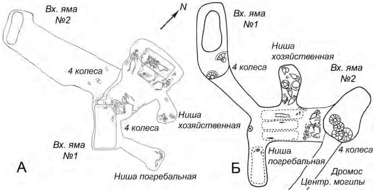
Рис. 1. Подобие схем вспомогательных погребальных сооружений Толстой и Гаймановой Могили.

А – боковая гробница Толстой Могили; Б – Северная гробница Гаймановой Могили.