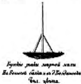
План Богданівської башти морського оптичного телеграфу

По них ми можемо судити про те, який був вигляд Старобогданівської вежі, яка, на жаль, не збереглася до наших днів, а була розтягнута місцевими жителями на камінь у 1990-х роках. Зараз на цьому місці є тільки пагорб і залишки фундаменту. Зображення цієї вежі є також і на картах лоцій XIX–XX ст. [12].