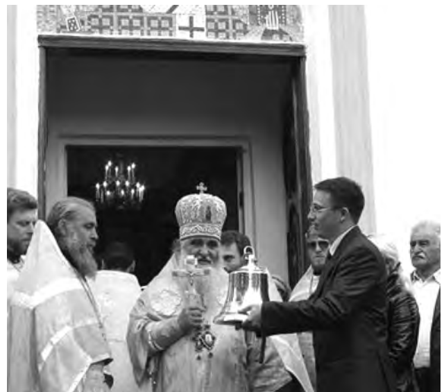
Вручення подарунку – корабельної ринди. 2010 р.