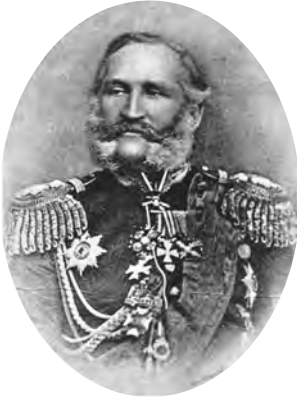
Микола Андрійович Аркас

Двічі був одружений: перший раз на Парасці Петрівні Зайцевській (1769-1817 (?)), другий – на Єфросинії Іванівні Кузнецовій (уродженій Богдановій) (1784-1862), від якої у нього було дві дочки – Любов Петрівна (у шлюбі Карабчевська) і Софія Петрівна, яка стала згодом дружиною Миколи Андрійовича Аркаса.