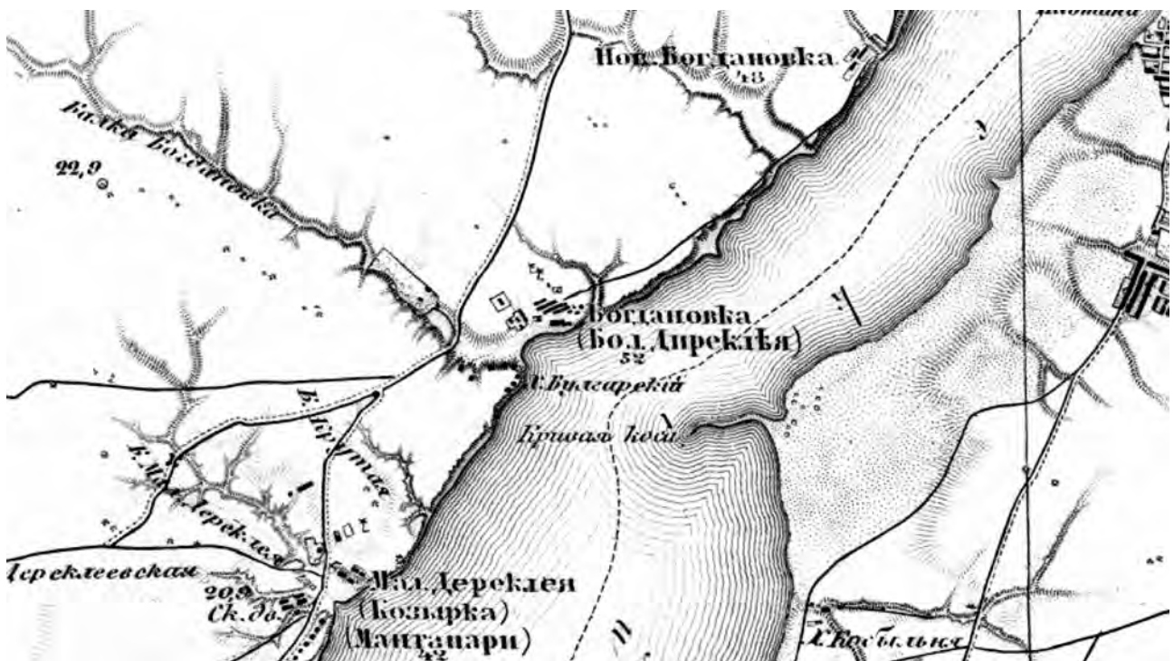
Богданівка (Велика Дереклія) на військовій карті початку XX ст.

З 1861 року Микола Аркас, за порадою лікаря, літні місяці проводив у Старій Богданівці. Займався господарством маєтку, яке приносило за тодішніми мірками непоганий прибуток,