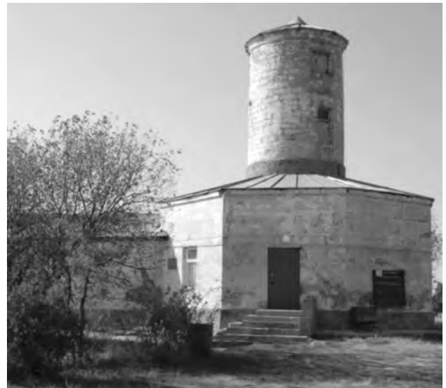
Парутинська башта морського оптичного телеграфу

Існувала у дореволюційний час у Старій Богданівці і досить оригінальна пам'ятка морської величі Російської імперії. У 20-х роках ХІХ ст. за наказом Головного командира Чорноморського флоту і портів адмірала А.С. Грейга для встановлення зв'язку між двома основними базами чорноморського флоту була прокладена оптична телеграфна лінія від Миколаєва до Севастополя. Ця лінія являла собою ряд кам'яних веж, розташованих у найбільш піднесених місцях на візуальному віддаленні одна від одної. Сигнали у них передавалися за допомогою фігур, які зображувалися із трьох зчленованих між собою в ряд ціпків – двох коротких по краях і однієї довгої посередині. Кожна комбінація із цих ціпків позначала певну букву.