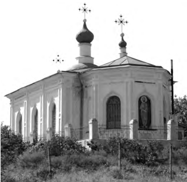
Свято-Миколаївський храм. 2012 р.

Натомість відбулися певні і позитивні зрушення у житті старобогданівців. Так, наприклад,