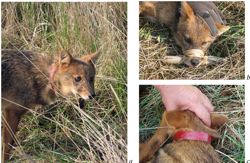
Рис. 1. Шакал, позначений кольоровою міткою на шії (пониззя Дністра, 07.10.2007 р.): a – звір з кольоровою міткою, b – звір, що був зіструнений для мічення, c – процес чіплення мітки.