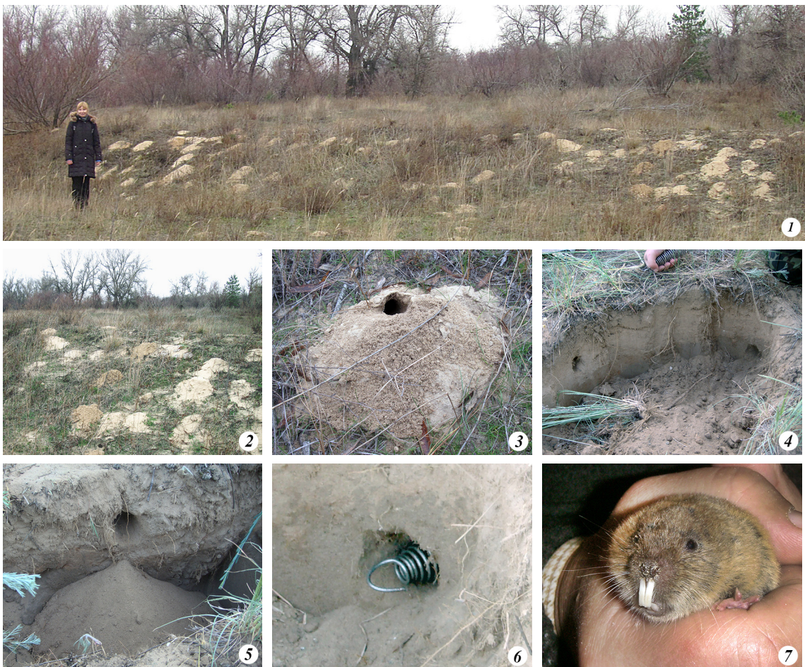
Рис. 3. Вибір місця та техніка встановлення пастки Голова для відлову сліпачка: 1 — вибір ділянки зі щільним розміщенням колоній, 2 — загальний вигляд групи кротовин з ближньої відстані, 3 — окремий свіжий і ще не закритий віднорок в процесі формування кротовини, 4 — розкоп лопатою ґрунту для відкриття ходів сліпачка, 5 — хід, який сліпачок почав засипати, 6 — пастка, встановлена в норі сліпачка, 7 — сліпачок, зловлений з норі.

Для відлову тварин спочатку обирають заселену сліпачками ділянку (рис. 3, 1–3). Для цього важливо оцінити такі параметри: 1) наявність свіжих викидів (принаймні 3–5), що мають ознаки недавнього вигрібання (вологий ґрунт), цілісні необсипані грудки, відсутність слідів перебування інших тварин, відсутність слідів обвітрявання; 2) розмір колонії, який має складати хоча би 20–30 пориїв на площі принаймні 30–50 м 2 , 3) відсутність покопок та інших слідів полювання хижаків, зокрема лисиць. За цих умов ефективність лову є максимальною.