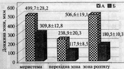
Fig. 2. Length of growth zone of main root of 6-day Brassica rapa seedlings

Під впливом кліностакування довжина дистальної зони розтягу, як і інших ростових зон кореня, зменшилася, але не в такій мірі, як основна зона розтягу. Зменшення дистальної зони розтягу, яка, за сучасними уявленнями, відіграє ключову роль у гравітропічній реакції [12, 13, 18], можливо, пов'язане з меншою кількістю клітин, що знаходяться в цій зоні, оскільки суттєвих відмінностей у висоті цих клітин не спостерігалось.