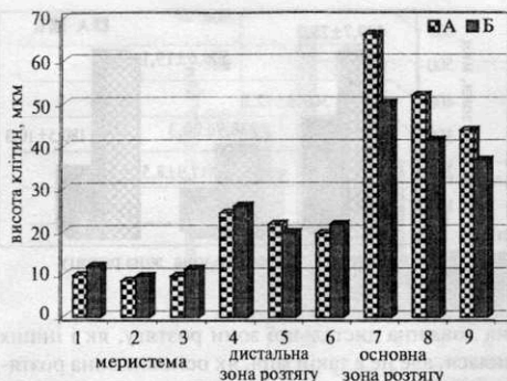
Рис. 3. Висота клітин різних ростових зон головного кореня проростків Brassica rapa