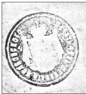
Жовківський д-т 1885 р.