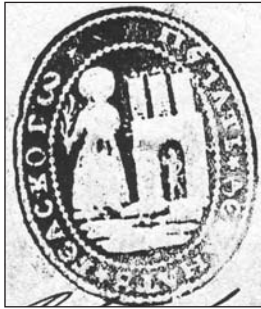
Белзький д-т 1885 р.