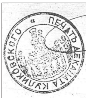
Куликівський д-т 1895 р.