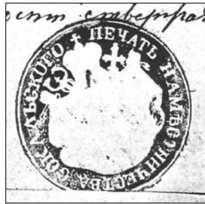
Сокальський д-т 1885 р.