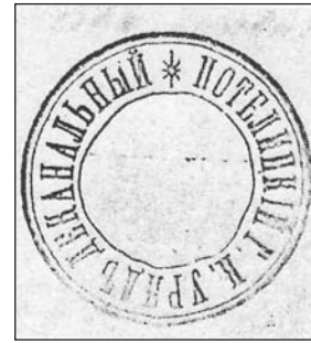
Потелицький д-т 1899 р.