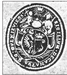
Жовківський д-т 1842 р.