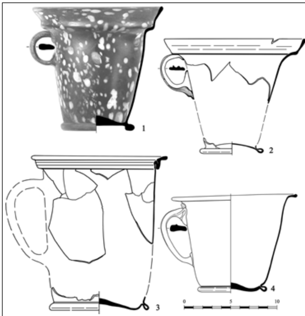
Рис. 1. Модіолуси: 1. АМ 1161/5333; 2. ДІМ (опис Б 15); 3. О-2011/Некр/101; 4. ДЕ (Ол.1902.47)

глухого білого та жовтого скла знаходиться в колекції Ермітажу. Він був знайдений у 1883 р. в похованні 6 некрополя Пантікапею [ОАК, 1891, с. XXV, XXVI; Naevernick, 1978; Nr. 91; Кунина, 1984, с. 147—148; табл. 1, 2]. Ще один кухоль зі столиці Боспорського царства зберігається в Луврі [Kern, 1956, taf. 223; Naevernick, 1978, Nr. 90]. Техніка «строкатої поверхні» була детально досліджена Фр. Фремерсдорфом [Fremersdorf, 1938]. Посудини, виготовлені в цій техніці, були широко розповсюджені в I ст. н.е. Н.З. Кунина вважала, що модіолуси з поліхромного скла виготовлялися в майстернях Північної Італії та надходили до Північного Причорномор'я із західної частини Римської імперії [Кунина, 1984, с. 149-151].