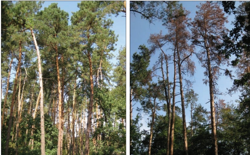
Рис. 1. Зовнішній вигляд рослин Pinus sylvestris L. на моніторингових ділянках: а – здорові сосни, б – всохлі сосни

На даний час зусилля науковців усього світу зосереджені на дослідженні інвазивних видів нематоди в соснових насадженнях [1]. При цьому питання імунітету рослин до хвороб і шкідників рослин залишаються, на жаль, поза їхньої уваги. Етіологія всихання – слабо вивчений і не зрозумілий розділ лісової патології. Однобокість трактувань причинно-наслідкових зв'язків загалом характеризується доволі спрощеним підходом, за яким пояснюється першопричина за будь-яким зрозумілим фактором впливу. Всихання дерев одного або декількох видів, особливо на різних стадіях онтогенезу – процес розтягнутий у часі та просторі, який залежить від безлічі чинників. Оскільки лісові екосистеми – найбільш складні біологічні комплекси в органічному світі, патологічні процеси, що в них відбуваються, це завжди взаємодія величезної кількості організмів різних таксономічних груп. Тому проблему масового всихання сосен необхідно розглядати з позиції синекології та біогеоценології, враховуючи, що загибель рослин на заключному етапі викликають фітопатогенні мікроорганізми та шкідники.