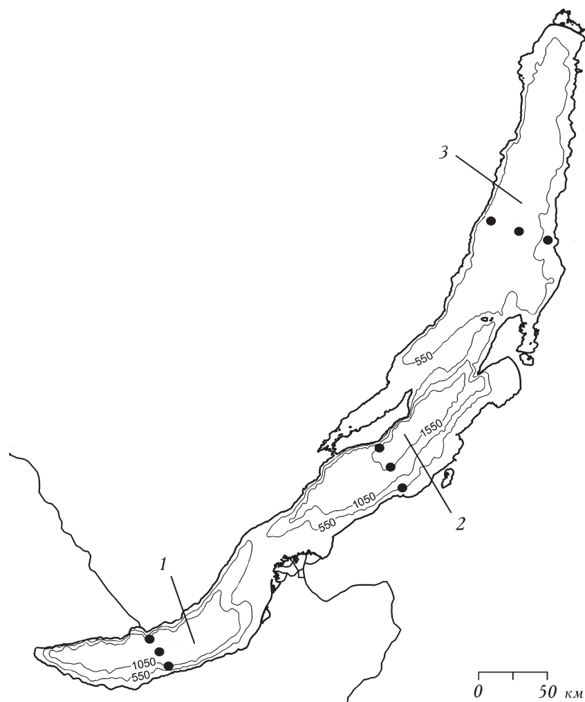
1. Расположение станций на акватории оз. Байкал. Здесь и на рис. 2 точками отмечены станции: 1 — Южная котловина; 2 — Средняя котловина; 3 — Северная котловина.

километрах от берега. Материал отбирали сетью Джеди диаметром 37 см с размером ячеей фильтрующего сита 88 мкм с глубины 50 м до поверхности и фиксировали 4%-ным формалином. Пробы обрабатывали счетным методом [1].