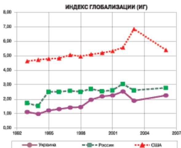
Рис. 4. Индекс глобализации [10]

ря довольно высокой позиции Российской Федерации в показателе политической глобализации по общему индексу (Iг) она занимает 39-е место. Украина по системе КОФ находится на 64-м месте, позади Кении и перед Перу. Видим, что она почти в 2,4 раза медленнее глобализуется, чем Соединенные Штаты, и в 1,2 раза — чем Россия. Видим, что уровень интегрированности в мир экономики США за последние 13 лет оказался практически одинаковым. Украина и Россия, находясь в бурном переходном процессе, уверенно движутся от практически замкнутых экономик к либеральным и интегрированным в мир. Уровень экономической глобализации России за этот период возрос на 310%, а Украины — на 640% (рис. 4.) [10].