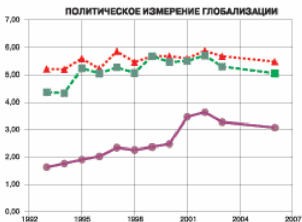
Рис. 3. Политическое измерение глобализации (Igp) [10]

ря довольно высокой позиции Российской Федерации в показателе политической глобализации по общему индексу (Iг) она занимает 39-е место. Украина по системе КОФ находится на 64-м месте, позади Кении и перед Перу. Видим, что она почти в 2,4 раза медленнее глобализуется, чем Соединенные Штаты, и в 1,2 раза — чем Россия. Видим, что уровень интегрированности в мир экономики США за последние 13 лет оказался практически одинаковым. Украина и Россия, находясь в бурном переходном процессе, уверенно движутся от практически замкнутых экономик к либеральным и интегрированным в мир. Уровень экономической глобализации России за этот период возрос на 310%, а Украины — на 640% (рис. 4.) [10].