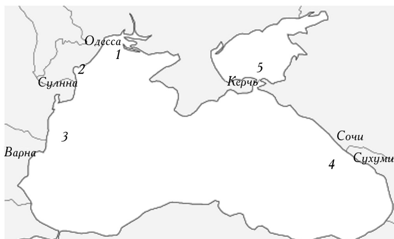
1. Районы отбора проб: 1 — Одесский регион; 2 — Жебриянская бухта; 3 — западная часть Черного моря; 4 — кавказский шельф; 5 — Азовское море и Керченский пролив.

Для оценки степени влияния качества грунта, глубины и солености на изменчивость формы раковины двустворчатого моллюска A. kagoshimensis Черного моря использовали метод дисперсионного анализа.