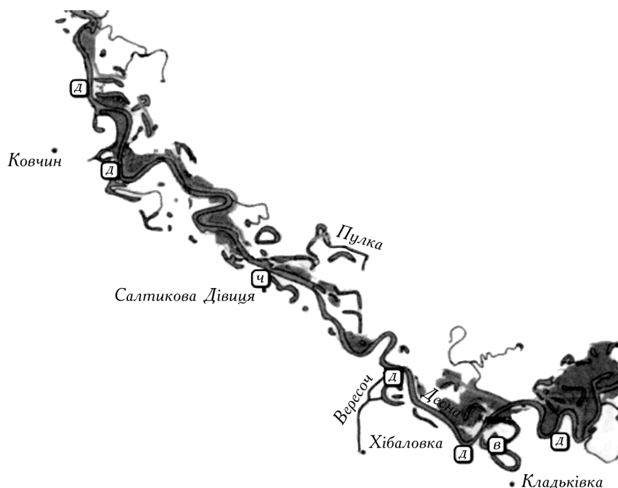
1. Карта-схема розташування пунктів відбору проб іхтіологічного матеріалу: Д — р. Десна, Ч — оз. Чернече, В — оз. Вольжин.

маса — 850—1970 г (середня 1440 \pm 128 ), вік 3 + ...5 +; судак звичайний ( Sander lucioperca L.) — довжина 46,8—53,7 см (середня 49,7), маса 730—1400 г (середня 965 \pm 74 ), вік 4 + ...5 +; окунь звичайний ( Perca fluviatilis L.) — довжина 17,5—22,2 см (середня 20,7), маса 60—110 г (середня 81,3 \pm 6,2 ), вік 3 + ...4 +; йорж звичайний ( Gymnocephalus cernuus L.) — довжина 12,4—15,5 см (середня 12,5), маса 30—80 г (середня 50,6 \pm 5,8 ), вік 2 + ...4 +; плітка звичайна ( Rutilus rutilus L.) — довжина 20,2—32,2 см (середня 25,7), маса 120—420 г (середня 245 \pm 38 ), вік 3 + ...5 +; лящ ( Abramis brama L.) — довжина 29,6—36,2 см (середня 32,7), маса 910—1290 г (середня 1016 \pm 83 ), вік 4 + ...5 +; плоскирка ( Blicca bjoerkna L.) — довжина 20,9—33,2 см (середня 25,2), маса 110—270 г (середня 153 \pm 24 ), вік 3 + ...4 +; чехоня ( Pelecus cultratus L.) — довжина 29,4—35,5 см (середня 31,8), маса 120—200 г (середня 143 \pm 12 ), вік 4 + ...5 +. У кожний із сезонів обстежено по 17—31 особин різних видів.