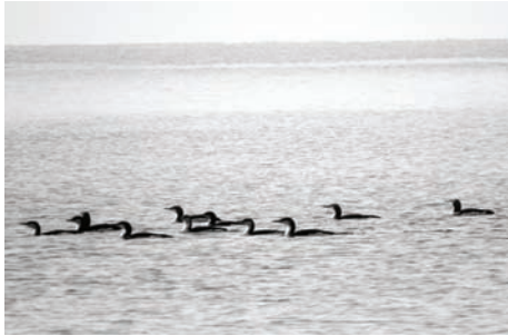
Рис. 3. Чернозобые гагары.