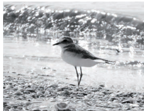
Рис. 8. Морской зуек.

Необходимо отметить, что за время наблюдений отмечено 7 видов птиц (полевой лунь, луговой лунь, авдотка, кулик-сорока, галстучник, морской зуек (рис. 8),