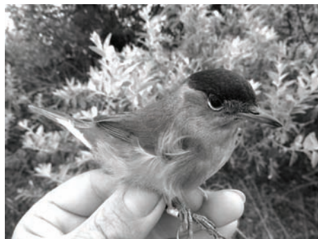
Рис. 5. Черноголовая славка.

Черноголовая славка ( Phylloscopus trochilus ), черноголовая славка ( Sylvia atricapilla ) (рис. 5) и славка-завирушка ( Sylvia curruca ) (рис. 6.). Из других семейств наиболее часто отмечались Мухоловковые ( Muscicapidae ), особенно серая мухоловка ( Muscicapa