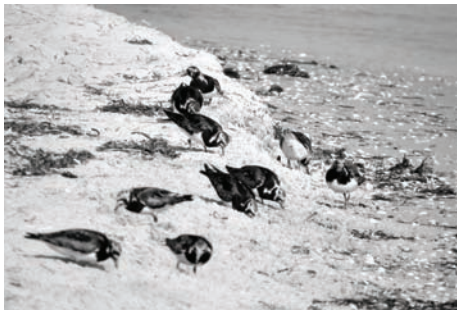
Рис. 4. Камнешарки.