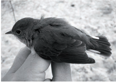
Рис. 7. Малая мухоловка.