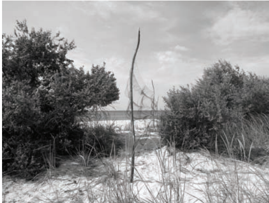
Рис. 2. Паутинные сети. Fig.2. Mistnets.

аллювиальной полосы (рис. 2). Всего проведено 8 ловушко-суток.