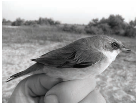
Рис. 6. Славка-завирушка.

Наиболее полно было представлено семейство Славковые ( Sylviidae ), 10 видов из 14 известных. Многочисленными были пеночка-весничка ( Phylloscopus trochilus ), черноголовая славка ( Sylvia atricapilla ) (рис. 5) и славка-завирушка ( Sylvia curruca ) (рис. 6.). Из других семейств наиболее часто отмечались Мухоловковые ( Muscicapidae ), особенно серая мухоловка ( Muscicapa