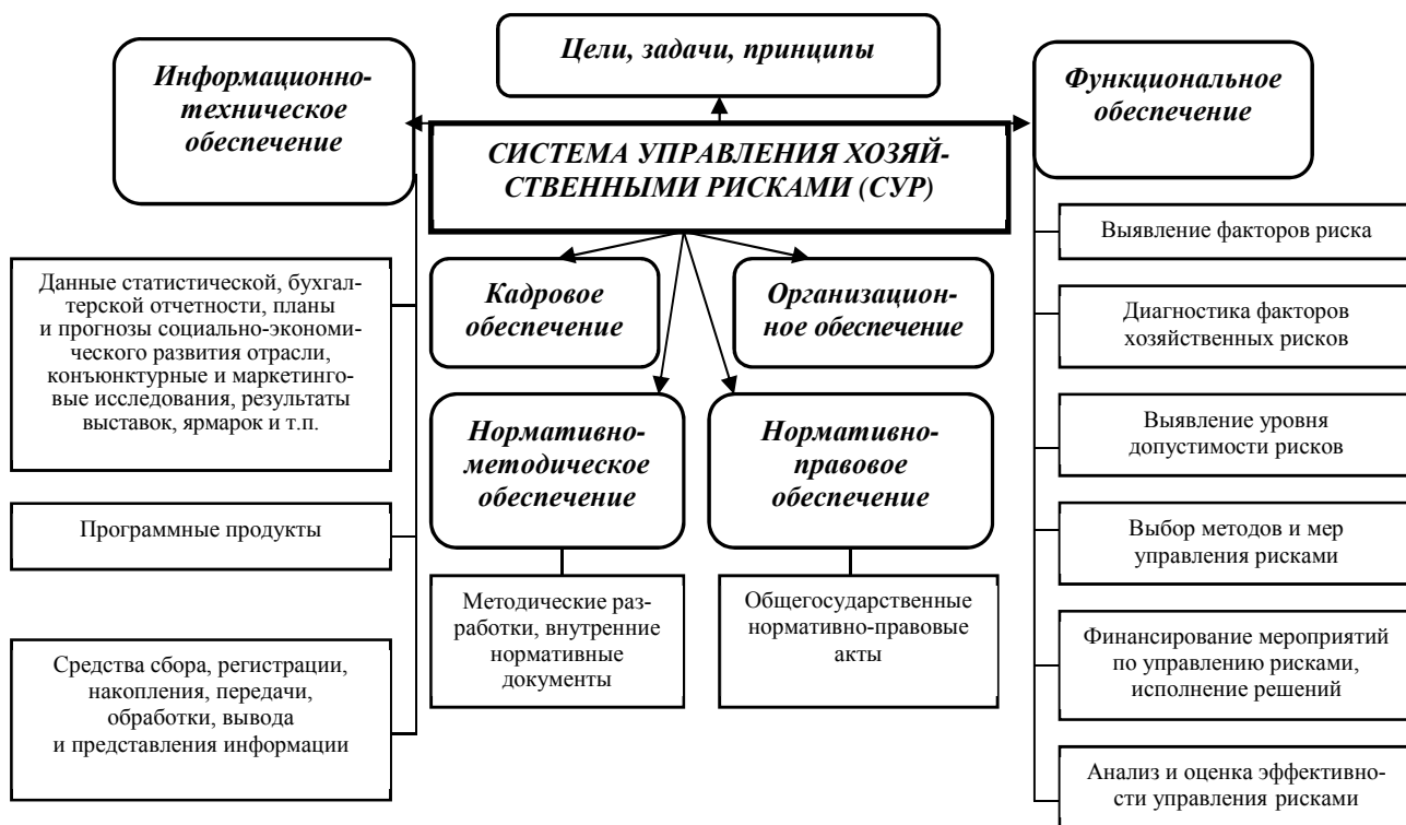
Рис. 2. Система управления хозяйственными рисками

– предложен детализированный процесс управления рисками, что позволило выделить три стадии, в том числе диагностику риск-факторов (рис. 3);