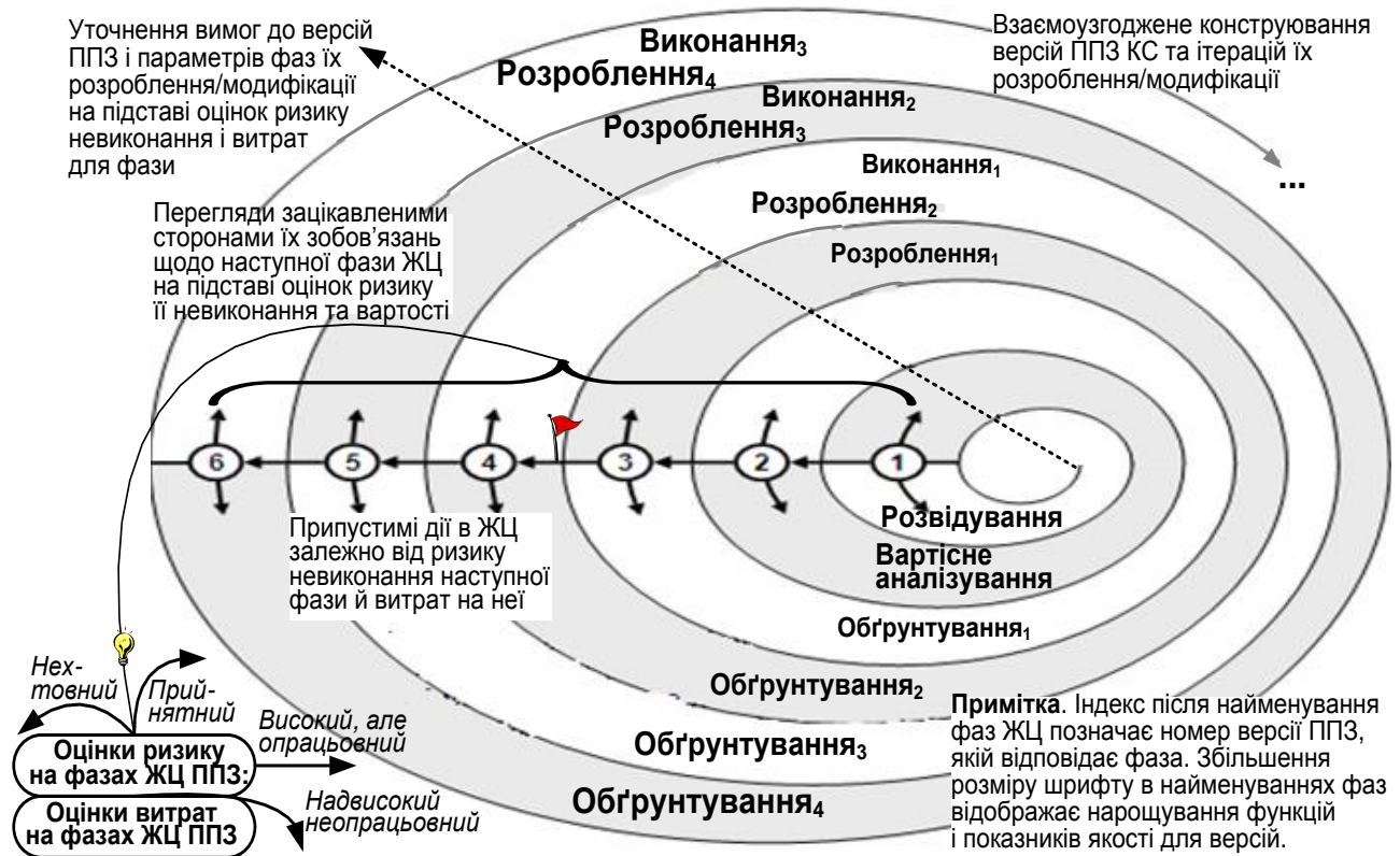
Рис. 1. Внутрішня структура ЖЦ ППЗ і КС за моделлю покрокових зобов’язань

Структуру ЖЦ за моделлю покрокових зобов’язань показано на рис. 1. Подані тут «кільця спіралі» й занумеровані кружечки на них відображають ітерації з їх фазами (назви яких показано всередині кільця) і, відповідно, пофазні перегляди з припустимими зобов’язаннями.