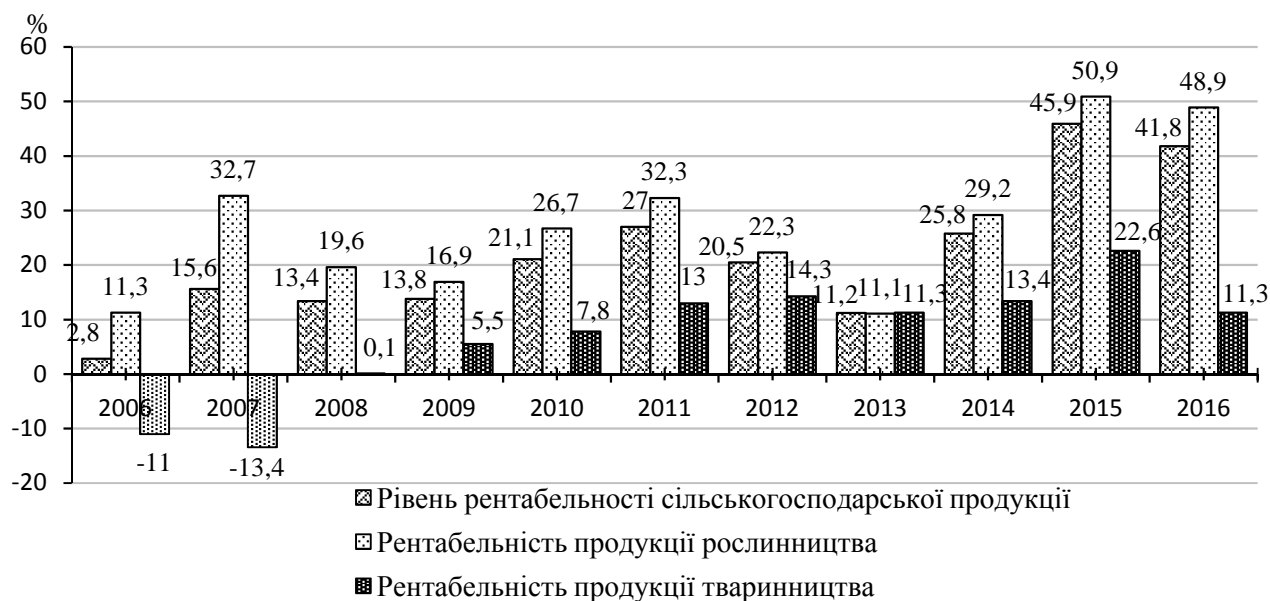
Рис. 1. Рентабельність виробництва сільськогосподарської продукції, %

зовнішньоторговельне сальдо. Рентабельність виробництва сільськогосподарської продукції представлено на рис. 1.