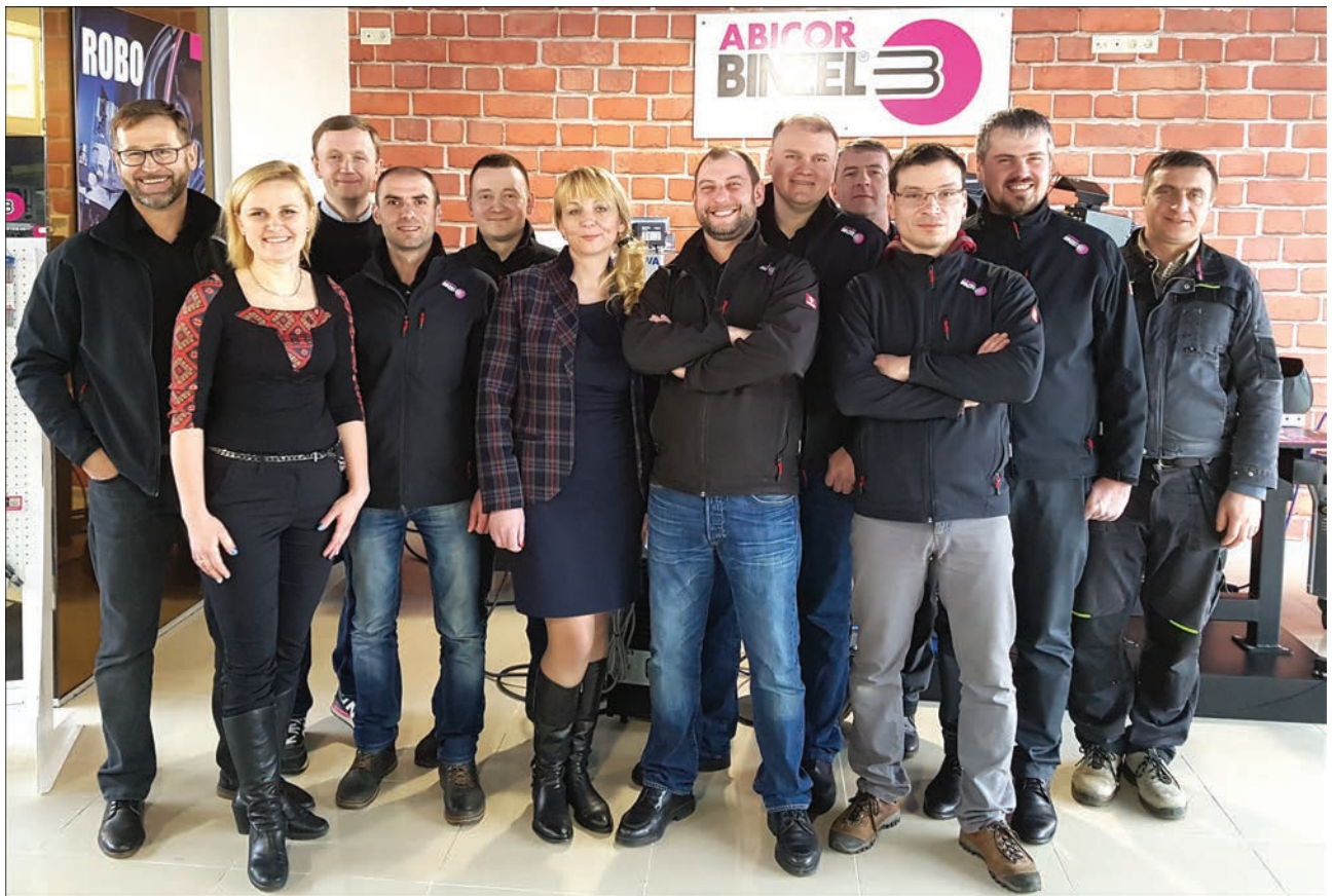
Колектив компанії ПІІ ТОВ «БІНЦЕЛЬ Україна ГмбХ»