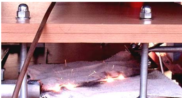
Рис. 2. Внешний вид остывающих на атмосферном воздухе и асбестовом полотне квантованных сферообразных «горячих» (шириной \Delta z_{nh} \approx 7 мм) и цилиндрических внутренних «холодных» (шириной \Delta z_{nci} \approx 27 мм) продольных участков (макроскопических зон квантованных продольных ВЭП) оцинкованного стального провода ( r_0=0,8 мм; l_0=320 мм; \Delta_0=5 мкм; S_0=2,01 мм 2 ) сразу после воздействия на него аperiodического импульса аксиального тока i_0(t) временной формы t_m/\tau_p=9 мс/160 мс большой плотности ( I_{om}=745 А; t_m=9 мс; \tau_p=160 мс; \delta_{0m} \approx 0,37 кА/мм 2 ; n=\bar{n}=9 ) [1]

ширин ( \Delta z_{nh} \approx 7 мм) соответствующих участков указанного провода. Отсюда можно обоснованно заключить, что квантованная ширина \Delta z_{nh} «горячего» продольного участка ВЭП металлического проводника согласно (20) является также усредненной геометрической характеристикой продольного ВЭП. Ее численное значение при неизменном значении \delta_{0m} в исследуемом проводнике остается также неизменным, что подтверждается результатами выполненных в НИПКИ «Молния» НТУ «ХПИ» высокотемпературных экспериментов с использованием подобного стального провода ( r_0=0,8 мм; l_0=320 мм; \Delta_0=5 мкм; S_0=2,01 мм 2 ) [1, 2, 5]. Приведенные выше расчетно-экспериментальные данные для ширины \Delta z_{nh} ВЭП указывают на правомерность выбора по (5) с учетом соотношения n_m=2n_k^2 усредненного значения \bar{n} для целого квантового числа n .