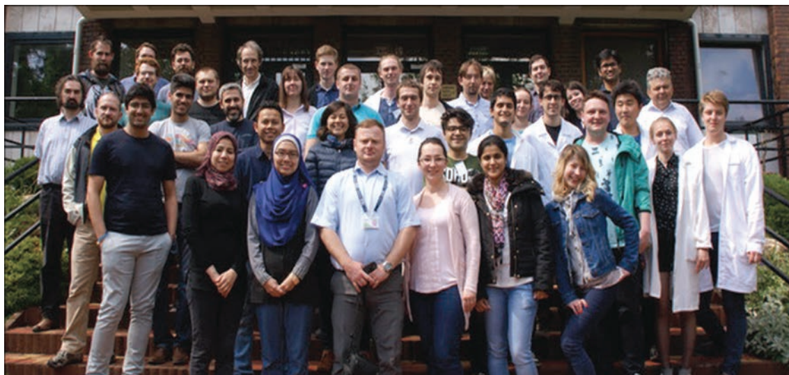
Организаторы и участники CETS 2016 перед центральным входом в корпус BRR