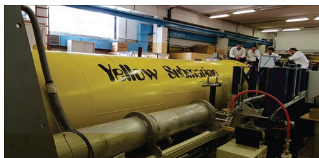
Дифрактометр малоуглового рассеяния нейтронов (SANS «Yellow Submarine»)

научного и культурного наследия» (проф. М. Rogante, REO, Италия) и др.