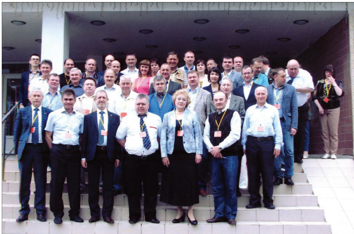
Участники международной конференции «Дуговая сварка. Материалы и качество», 31 мая – 3 июня 2016 г., Волгоград