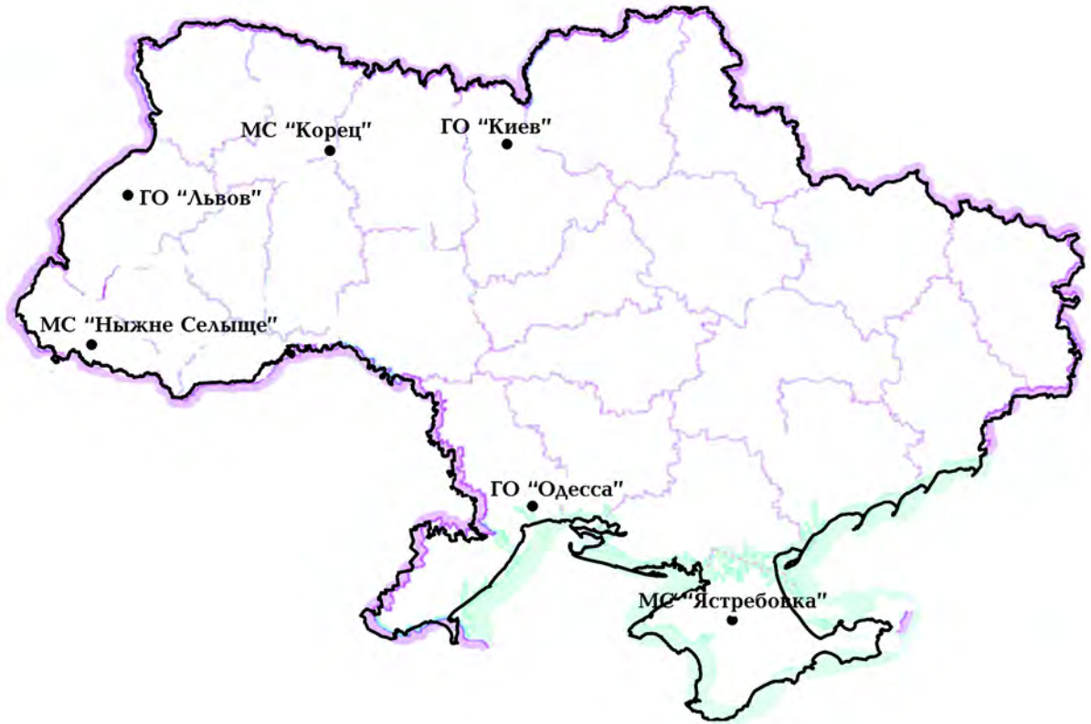
Рис. 1. Сеть магнитных станций Института геофизики НАН Украины (МС — магнитная станция, ГО — геофизическая обсерватория с магнитной станцией).