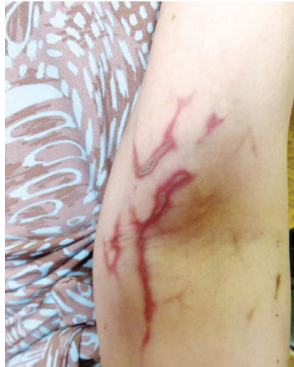
Рис. 2. Гострий флебіт поверхневих вен верхньої кінцівки на фоні ПХТ

терапії в ДУ «Інститут очних хвороб і тканинної терапії ім. В.П. Філатова Національної академії наук України» (Одеса) з приводу метастатичного відшарування сітківки лівого ока (системного впливу на пухлинний процес фототерапія не мала, тому хвора брала участь у дослідженні).