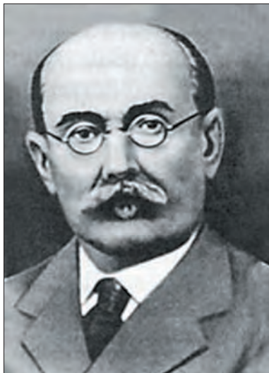
Липський Володимир Іполитович (11.03.1863— 24.02.1937) президент ВУАН у 1922– 1928 рр.

Військово-промислового комітеті. На початку 1921 р. В.І. Липський став членом Угової комісії з об'єднання Української академії наук з Українським науковим товариством, сприяв діяльності Всенародної (національної) бібліотеки України 17 . Його науково-організаційна діяльність в Академії була відзначена орієнтацією на наближення академічних досліджень до реальних потреб економічного розвитку країни.