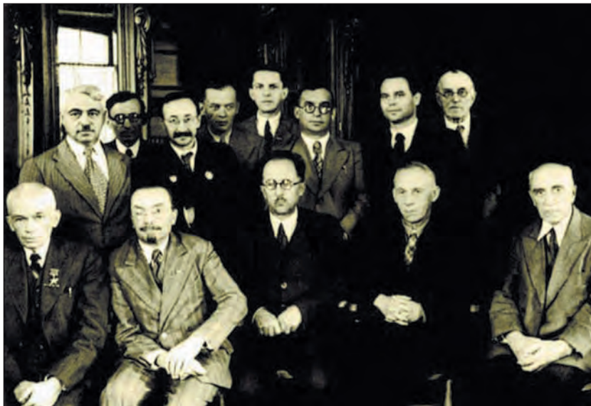
Перше засідання Президії АН УРСР після повернення Академії з евакуації до визволеного Києва. 1944 р.

займав мужню позицію в питаннях захисту вчених під час політичних репресій 1930-х років, зокрема відстояв М.В. Птуху, К.Г. Воблого, О.І. Лейпунського, А.Ю. Кримського, М.М. Крилова та ін. 33