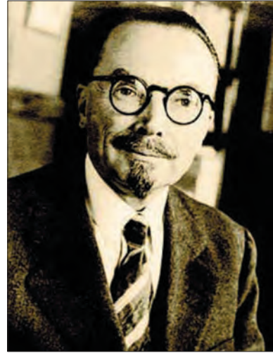
Палладін Олександр Володимирович (10.09.1885– 06.12.1972) президент АН УРСР у 1946–1962 рр.

ло актуальні напрями того періоду розвитку УРСР. У цих відділах створилися нові інститути. Одночасно низку інститутів було передано Українській академії сільськогосподарських наук 37 . На початку 1950-х років кількість установ Академії виросла до 68 (51 науково-дослідна і 17 допоміжних) 38 . У 1950-х роках відбувається подальше вдосконалення структури Академії, зміцнюється матеріально-технічна база і значно збільшується капітальне будівництво.