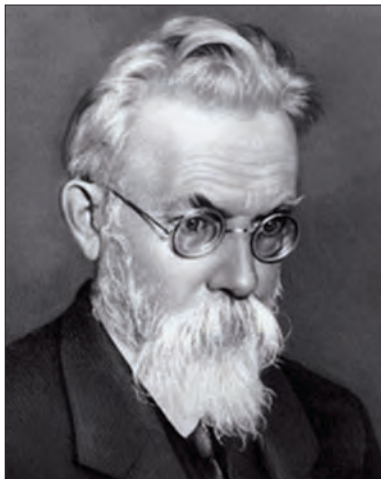
Вернадський Володимир Іванович (12.03.1863– 06.01.1945) засновник і перший пре- зидент УАН у 1918–1921 рр.

українського народу, для якого створення УАН мало величезну вагу, ставши одним із символів національного відродження 6 .