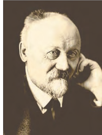
Заболотний Данило Кирилович (28.12.1866– 15.12.1929) президент ВУАН у 1928–1929 рр.

На період президентства Д.К. Заболотного припадають і прийняття нового Статуту Академії, запропонованого радянським урядом, і зміни в організаційній структурі, і створення Ради ВУАН, і ліквідація місцевих наукових товариств. Серед позитиву — організація ряду нових інститутів біологічного й технічного профілю, зокрема Інституту мікробіології й епідеміології, який сьогодні носить ім'я його першого директора — Д.К. Заболотного.