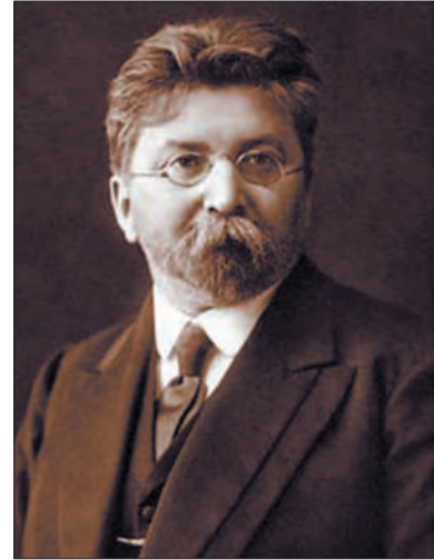
Василенко Микола Прокопович (14.02.1866– 03.10.1935) президент ВУАН у 1921–1922 роках

Створення Академії передбачало взаємозв'язок таких національних інституцій, як Національна академія наук, Національна бібліотека та Національний музей — базових для розвитку науки та культури центрів, що ство-