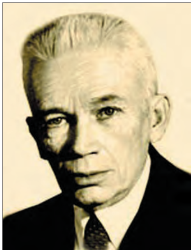
Богомолець Олександр Олександрович (24.05.1881– 19.07.1946) президент АН УРСР у 1930–1946 рр.

У липні 1930 р. президентом Академії обирають Олександра Олександровича Богомоляця (1881–1946) 28 . В історію вітчизняної науки він увійшов як засновник української школи патологічної фізіології, онкології, ендокринології, геронтології, гематології, автор численних фундаментальних наукових праць, присвячених здоров'ю людини, що вважалося дуже пріоритетним у медичній науці того часу 29 .