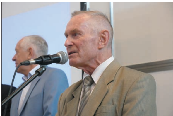
Виступ першого віце-президента НАН України академіка НАН України Антона Григоровича Наумовця