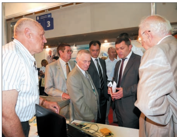
Огляд експозиційних стендів наукових установ і організацій НАН України