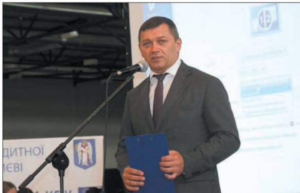
Перший заступник голови Київської міської державної адміністрації Микола Поворозник відкриває виставку «Зроблено в Києві»