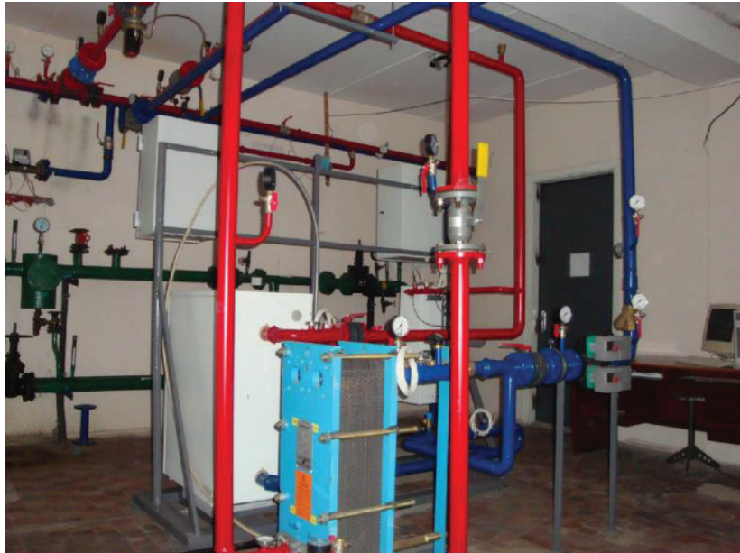
Рис. 5. Фото части ИТП с электродкотлами.

Проведена экспериментальная термомодернизация светопрозрачных ограждающих конструкций существующего здания (рис. 6) с помощью разных конструкций (камерности, толщины, профилей, низкоэмиссионного напыления и других эффектов) энергоэффективных окон. Создан полигон из 20 высокоэффективных окон одинакового периметра и одинаковой геометрии оконного переплета. Достигнуто уменьшение теплопотерь