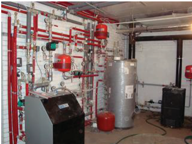
Рис. 2. Фото части теплонасосной системы теплообеспечения.

Преимущества - автономность электроснабжения; отказ от централизованных электросетей; экологичность; возможность продажи избыточной электроэнергии (например, летом, когда есть мощная инсоляция и отсутствуют потребности в отоплении) по «зеленому» тарифу; использование современных информационных smart-технологий; использование в зданиях типа «0-энергии» (где энергия потребляется в необходимом количестве, но генерируется собственно домом или на придомовой территории).