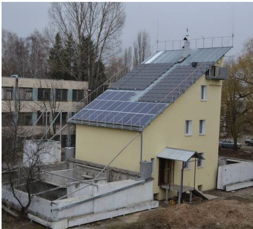
Рис. 1. Фото пассивного дома.