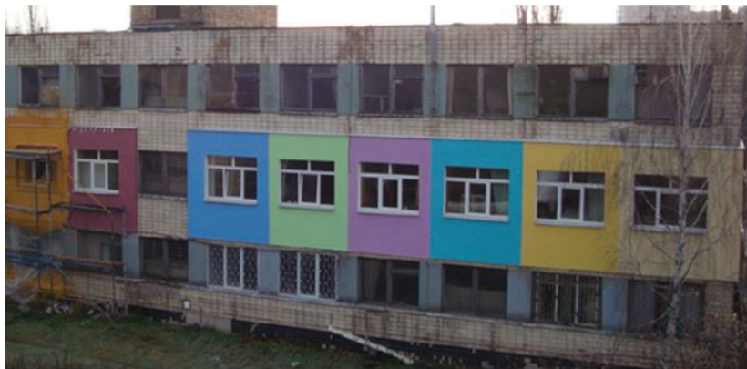
Рис. 6. Фото разновариантной термомодернизации части корпуса ИТТФ – полигон утепления стеновых конструкций и энергоэффективных окон.