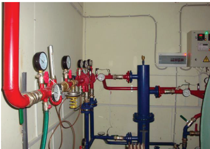
Рис. 4. Фото части ИТП с гидравлической стрелкой.

Преимущество по сравнению с традиционным элеваторным узлом - экономия теплоты от использования достигает 15...18 % за отопительный период.