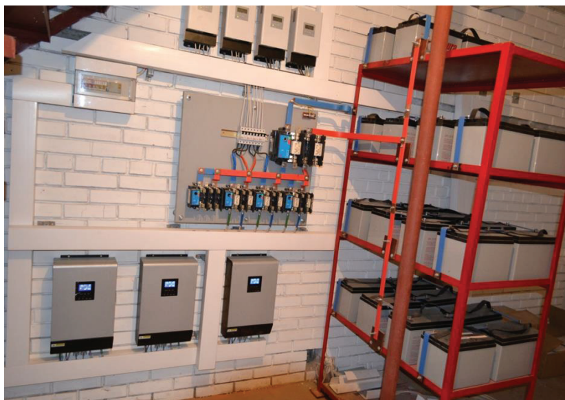
Рис. 3. Фото аппаратной части системы автономного электроснабжения.