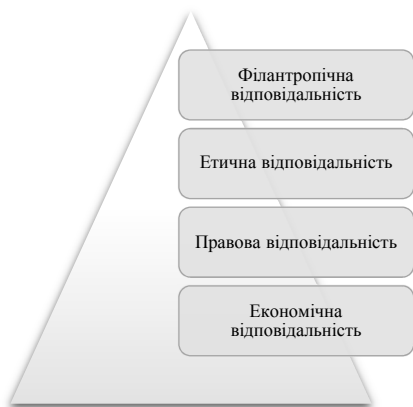
Рис. 2. Піраміда КСВ Керролла (1991 р.) [7]

У 2006 р. Візер дещо модифікував класичну модель Керролла і розробив піраміду КСВ для розвинених країн (рис. 3) [22]. На думку Візера, економічна відповідальність передбачає створення нових робочих місць, сплату податків, інвестування. Філантропічна – фінансування суспільно важливих проектів, правова відповідальність – налагодження партнерських відносин з органами державної влади. Етична відповідальність передбачає підзвітність бізнесу, несприйняття корупції, розробку кодексів етики, узгодження комерційної діяльності із суспільними інтересами. Автор зауважує, що в розвинених країнах основний акцент все ще робиться на економічній відповідальності, проте другою за пріоритетністю складовою стає філантропія.