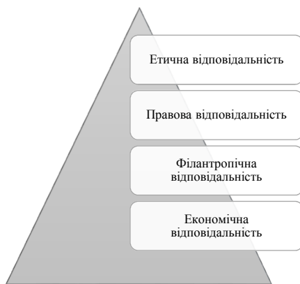
Рис. 3. Модифікована піраміда КСВ Візера (2006 р.) [22]

Важливою тенденцією останніх років є зміщення акцентів з економічної відповідальності на етичну. Виробництво товарів та послуг, підкріплене лише комерційними інтересами, втрачає суспільну цінність.