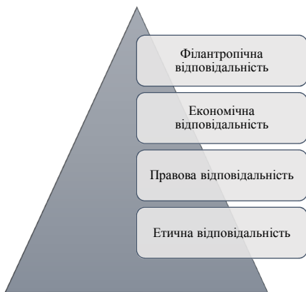
Рис. 4. Модифікована піраміда КСВ Д. Баден (2016 р.) [8]

Науковці британського університету Хаддерсфілд дещо модифікували піраміду, враховуючи сучасний розвиток міжнародної економіки (рис. 5). Зокрема, вони вводять поняття «глокальна відповідальність» (glocal responsibility). Глокалізація – це термін-гібрид від поєднання слів «глобальний» та «локальний» (global, local). Аналізуючи сучасний стан розвитку світової економіки, можна помітити тісні зв'язки між процесами, що проявляються на національно-господарському рівні, та процесами глобалізації. Усе більше транснаціональних компаній позиціонують себе як «глокальні», підкреслюючи цим самим свою приналежність як до національної економічної системи, так і до міжнародної.