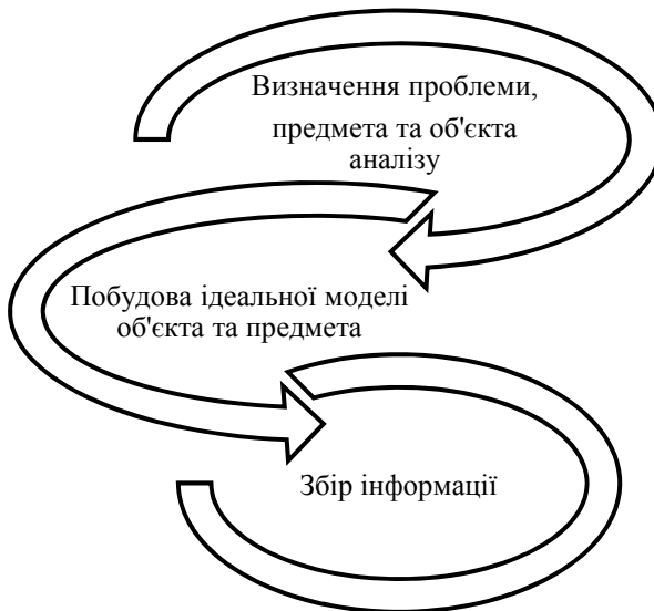
Рис. 1. Алгоритм інформаційно-аналітичної діяльності (етап 1)