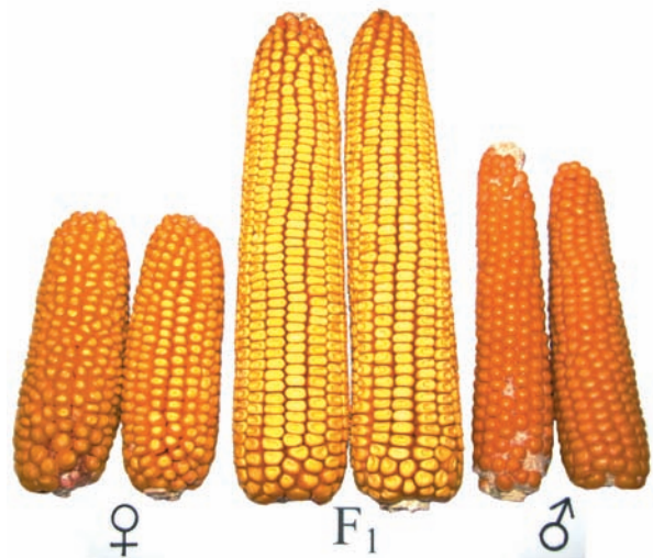
Технологія отримання гібридного насіння. Високопродуктивні качани гібрида (F 1 ) від схрещування двох самозапильних ліній (♀ × ♂)

Про виконання згаданої Постанови ЦК КПРС щодо створення ранньостиглих міжлінійних гібридів кукурудзи мені було доручено