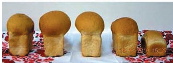
Скринінг якості хліба нових сортів озимої пшениці селекції Інституту фізіології рослин і генетики НАН України

у складі урядової делегації доповідати особисто Михайлу Сергійовичу Горбачову.