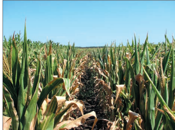
Зміни клімату. Посуха в Україні 2017 р. Більш як половина листя всохла ще до викидання мітелок. Втрати врожаю становили 50–80 %

За роки наукової діяльності мною особисто та у співавторстві створено 145 зареєстрованих сортів і гібридів рослин. Сорти вже 40 років висіваються на полях України та країн СНД. Площа посівів цих сортів у різні роки становила від 1 до 5,5 млн га щороку. Сьогодні сорти лише озимої пшениці висіваються на