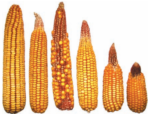
Зміни клімату. Посуха в Україні 2017 р. Зліва — качан урожаю в нормальні роки, решта качанів відображають втрати врожаю залежно від зони вирощування

площі близько 2 млн га, що становить 30 % усіх посівів цієї культури. Валовий збір зерна з наших сортів удвічі перевищує потреби України в продовольчому зерні пшениці.