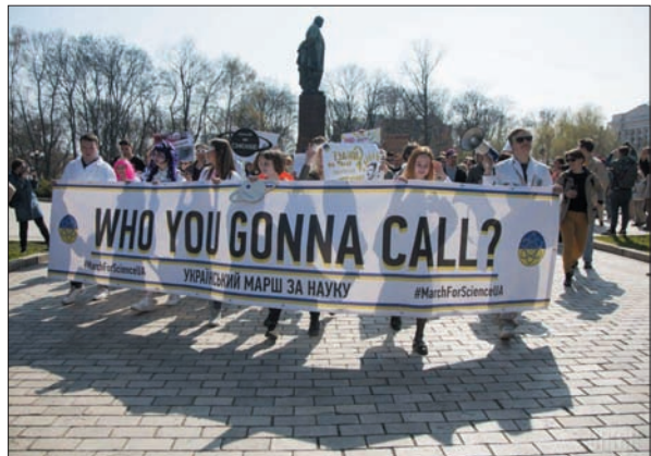
Український марш за науку. 14 квітня 2018 р.

вом «оперативно» мається на увазі не через кілька днів чи тижнів, а відразу, протягом лічених годин після її появи.