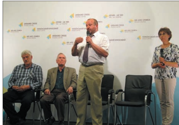
Брифінг науковців НАН України «Українські вчені для АТО: унікальні розробки, які можуть врятувати життя». Український кризовий медіа-центр. 2 червня 2015 р.

Отже, в Україні популяризація досягнень науковців Академії має на меті, по-перше, пояснити суспільству важливість науки для інноваційного розвитку людства загалом, по-друге, показати користь від діяльності науковців Академії зокрема, по-третє, розтлумачити справжні причини і джерела проблем, з якими стикається наукова сфера в Україні, і по-четверте, оперативно реагувати на маніпуляції та недостовірну інформацію, яка поширюється в ЗМІ і стосується Академії. Причому під сло-