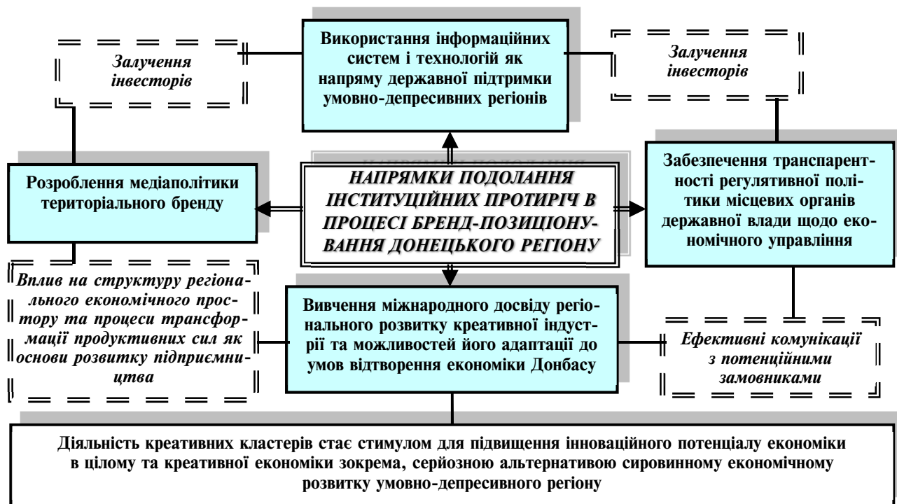
Рис. 2. Напрямки подолання інституційних протиріч в умовах відновлення економіки Донецького регіону (складено автором)

суспільства, деградацією господарського потенціалу, яка призвела до вимушеної міграції значних мас населення. Існують певні інституційні протиріччя, які доцільно згрупувати за характером та виділити такі групи: відтворювальні, цільові, територіально-галузеві та просторові. Для подолання інституційних протиріч у процесі економічного відтворення Донецького регіону запропоновано розроблення медіаполітики територіального бренду; забезпечення прозорості регулятивної політики місцевих органів державної влади щодо економічного управління; вивчення міжнародного досвіду регіонального розвитку креативної індустрії та можливостей його адаптації до вітчизняних умов; використання інформаційних систем і технологій як напряму державної підтримки умовно-депресивних регіонів. Кожен з цих напрямів потребує конкретизації форм і інструментів його практичного використання.