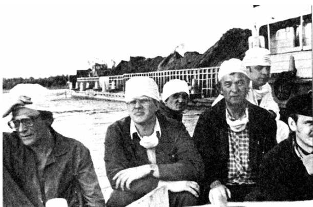
Учасники експерименту із захисту р. Прип'ять від забруднення радіонуклідами (1986 р.).

Першим великомасштабним натурним експериментом, проведеним на початку червня 1986 р. в рамках виконання зазначеної теми, були дослідження з дезактивації води р. Прип'ять шляхом адсорбції та коагуляції радіонуклідів на штучних сорбентах (попелові відходи Трипільської ТЕС), що завантажувалися у річкову воду.