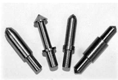
Рис. 2. Алмазные иглы гравировальных станков

Модуляция ударных импульсов – широтно-импульсная, частотно-импульсная, амплитудно-импульсная и их модификации.