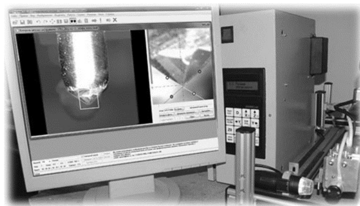
Рис. 3. Система контроля износа иглы

Автоматически вычисляется угол заточки иглы в градусах. Степень износа инструмента отображается в окне информации об износе (рис. 3).