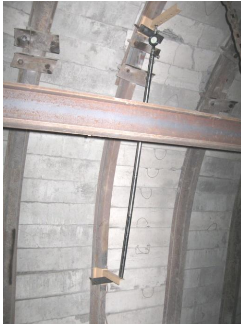
Рисунок 3 – Станція виміру в умовах шахти «Степова» ПАТ «ДТЕК Павлоградвугілля»

На першому етапі за результатами експертної оцінки умов експлуатації підготовчих виробок встановлюються найбільш характерні ділянки для монтажу вимірних станцій (рис. 3) для реєстрації деформацій елементів арочного кріплення.