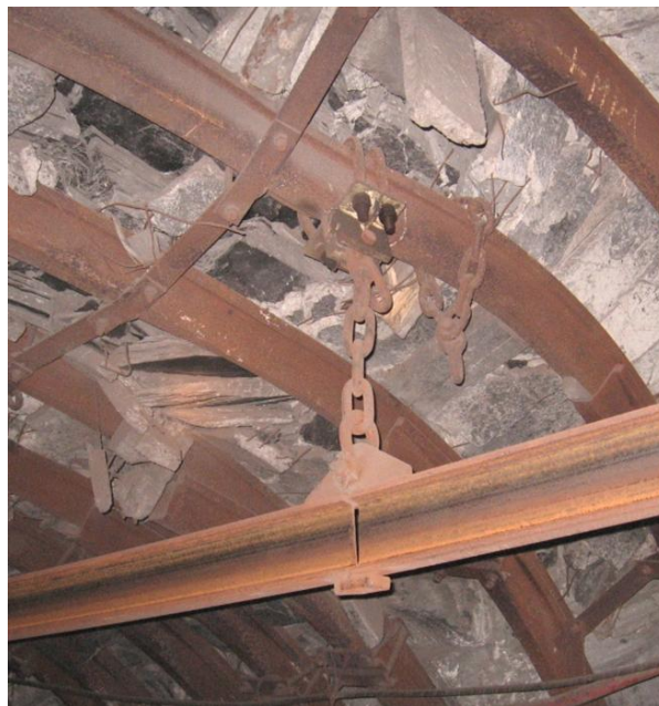
Рисунок 2 – Деформації порід навколо підготовчої виробки в умовах шахти ім. Стаханова

Процес моделювання особливостей взаємодії масиву гірських порід з кріпленням підготовчих виробок базувався на експериментальних дослідженнях та результатах прогнозу поведінки порід навколо підготовчої виробки з підвісними монорейковими дорогами в умовах шахти ім. Стаханова (рис. 2).