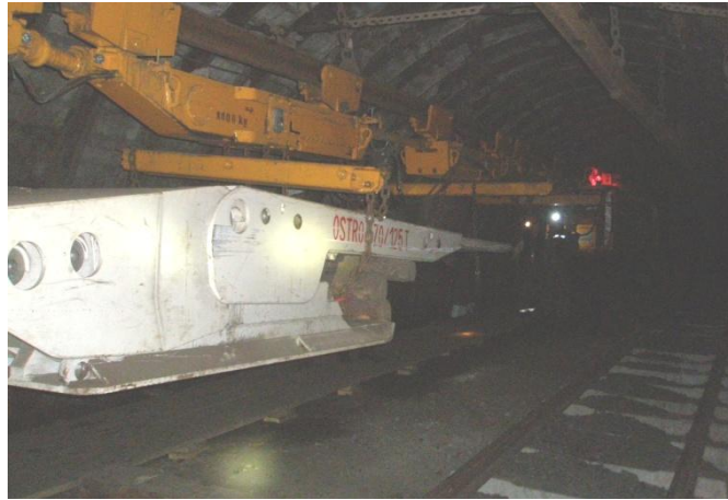
Рисунок 1 – Транспортування секцій механізованого кріплення у нерозібраному стані, шахта «Степова» ПАТ «ДТЕК Павлоградвугілля»

Для встановлення раціональних показників застосування підвісних монорейкових доріг було проведено моделювання негативних проявів гірського тиску навколо виробок.