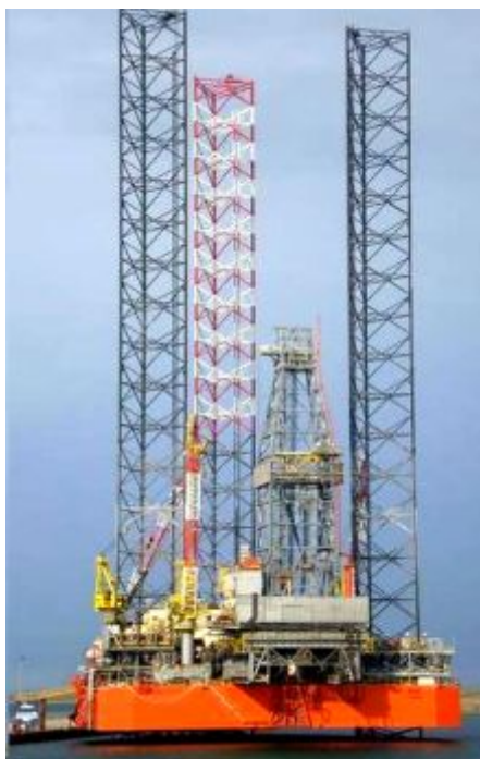
Рис. 1. СПБУ «Петр Годованец» в порту ГАО «Черноморнефтегаз»

Легкие гидроударные установки типа УМБ, созданные в Донецком национальном техническом университете в начале 2000 г, удерживают передовые позиции в отечественной практике бурения инженерно-геологических скважин на морских акваториях. В последнее десятилетие область применения таких установок значительно расширилась. Постоянное совершенствование и практическая реализация технических предложений и технологической схемы бесколлонной многорейсовой проходки скважин обеспечили возможность проведения изысканий установками на глубине до 50 м с борта неспециализированных судов с ограниченным набором оборудования (буровая лебедка, насос, штатная грузовая стрела) [1].