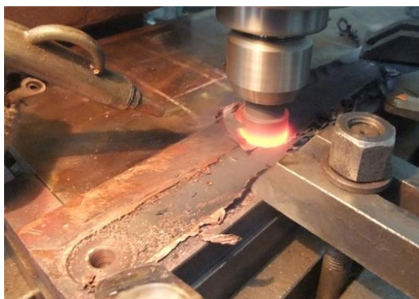
Рис. 1. Общий вид процесс наплавки медной плиты

Ремонтировали плиты следующим образом. На отработавшую ресурс плиту или ремонтируемый участок ее сегмента, предварительно отфрезерованный до необходимого уровня, накладывали пластину требуемого состава меди, и надежно закрепляли ее струбцинами. Затем специальный для СТП вращающийся инструмент внедряли в наплавляемую пластину, разогревали ее до температуры пластичности, создавая перемешивание наплавляемого металла с металлом основы. На рис.1–3 показан процесс наплавки.