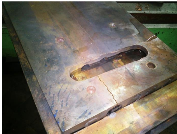
Рис. 3. Общий вид деформации и трещины на обратной стороне плиты МНЛЗ после нанесения слоя меди вдоль плиты методом НТП без дополнительного охлаждения

Одним из этапов восстановления медных плит кристаллизаторов является нанесение методом НТП мм слоя никеля толщиной 3 мм.