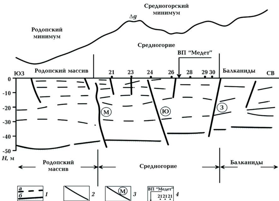
Рис. 2. Фрагмент сейсмического разреза по профилю Петрич—Никополь в участке Средногорского гравитационного минимума (по [Вольвовский и др., 1985]): 1 — сейсмические границы (а), поверхность Мохо (б); 2 — разломы; 3 — мантийные разломы (Маришский тектонический шов (М), Забалканский (З), Южно-Средногорский (Ю)); 4 — значение на профиле взрывного пункта и номер точек регистрации.

По длине VII международного профиля прослежена серия сейсмических границ, включая и поверхность раздела Мохо. Севернее Южно-Средногорского мантийного разлома четыре, а южнее — три. Самая верхняя граница, установленная только в депрессиях, связывается с фундаментом и представленными, главным образом, докембрийскими метаморфитами и герцинскими гранитоидами. Она отлича-