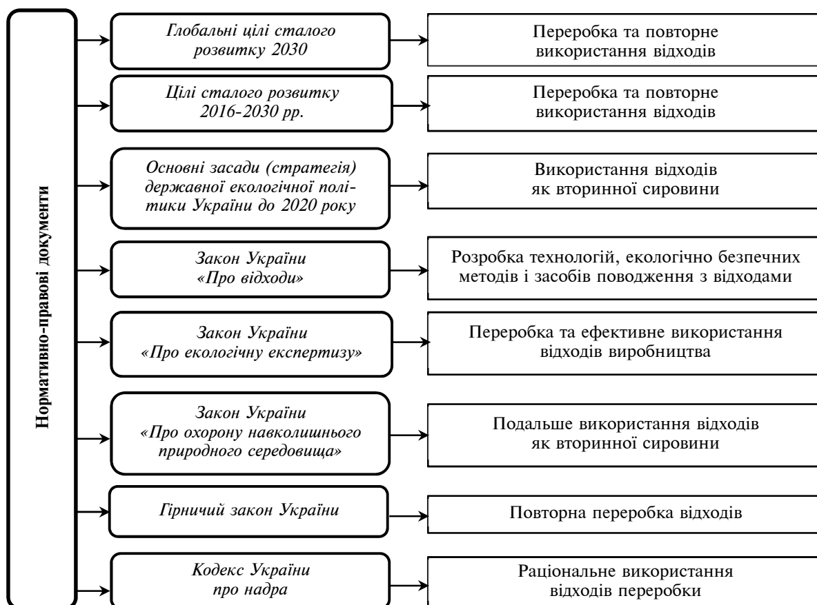
Рис. 2. Перелік нормативно-правових документів, у яких прописано про повторну переробку та вторинне використання відходів (побудовано на основі [2; 3; 16; 17; 20; 24; 27; 28])

Так, у Гірничому законі України серед основних екологічних вимог у сфері проведення гірничих робіт визнано раціональне використання мінеральних відходів порідних відвалів (сховищ) для повторної переробки на основі широкого застосування новітніх технологій [20].