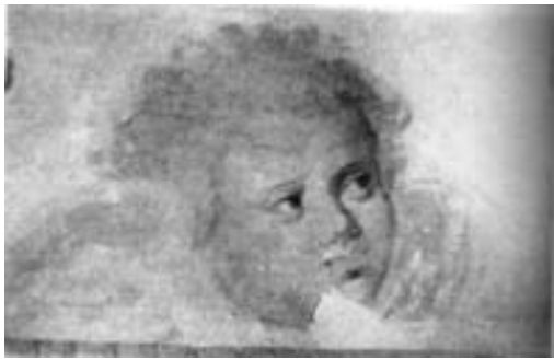
Лл. 2. Зображення херувима в нижній частині центрального підбанника Троїцького собору (А. Адруг. «Живопис Чернігова другої половини XVII – початку XVIII століття»).

надпис про ктиторів собору, збереглося зображення херувима над словами «начат здатися коштом» 7 .