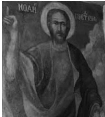
Лл. 3. Іоанн Предтеча. Сучасний вигляд у стінописі Троїцького собору.

Меценатська діяльність Івана Мазепи не обмежувалась лише зведенням Троїць-