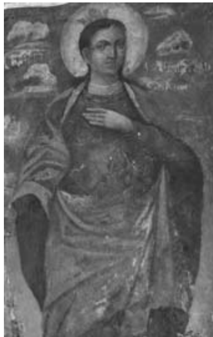
Лл. 4. Великомучениця Тетяна. Сучасний вигляд у стінописі Троїцького собору.