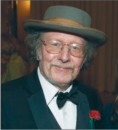
Джеффри Холл (Jeffrey C. Hall)