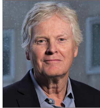
Майкл Янг (Michael W. Young)