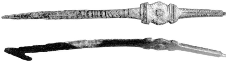
Рис. 1. Деталь застежки воинского пояса, найденная вблизи места находки монетного клада у с. Репино. Длина 153 мм.

О времени начала дислокации в округе Херсонеса римских подразделений можно судить по датировке херсонесского декрета 173/174 г. в честь легата Кальпурниана и его супруги, прибывшим, как очевидно, вместе с подразделениями подчиненных легату войск [8, с. 58-86; 9].