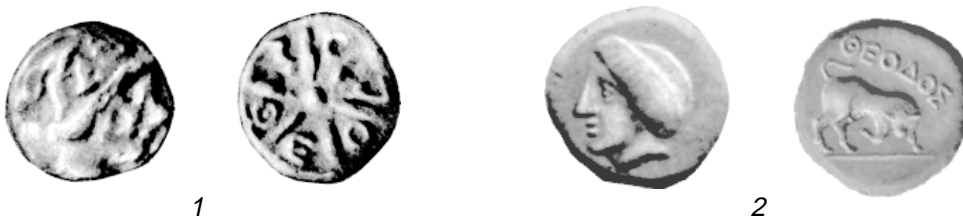
Рис. 2. Доработанная гравировкой (1) и поддельная (2) монеты Феодосии; в надписях написание сигмы не соответствует греческой палеографии.

В статье не ставилась задача окончательно решить все далеко не простые вопросы, связанные с хронологией и периодизацией монетной чеканки Феодосии; преследовалась цель наметить основные направления в типологии продукции монетного производства античной Теодеи-Феодосии.