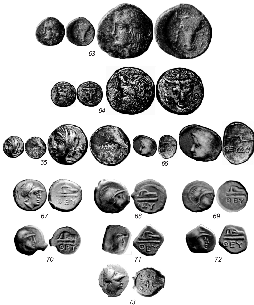
Табл. I (продолжение). Монеты Феодосии (63-72) и боспорская монета Левкона II (73). 63-66 - серебряные, 67-73 - медные.