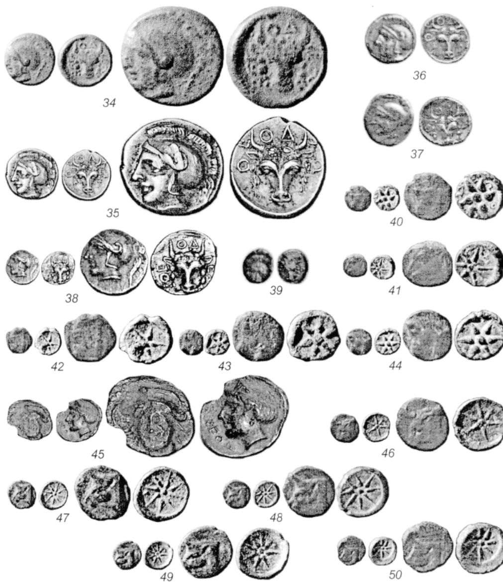
Табл. I (продолжение). Монеты Феодосии. 34-39, 45 - серебряные, 40-45, 46-50 - медные.