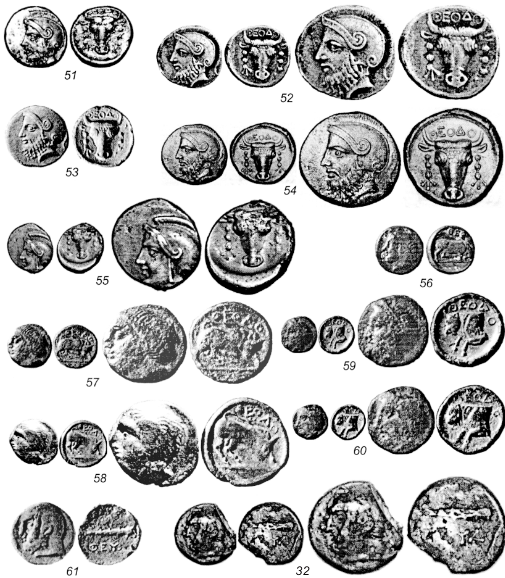
Табл. I (продолжение). Монеты Феодосии. 51-55, 61-62 - серебряные, 56-60 - медные.