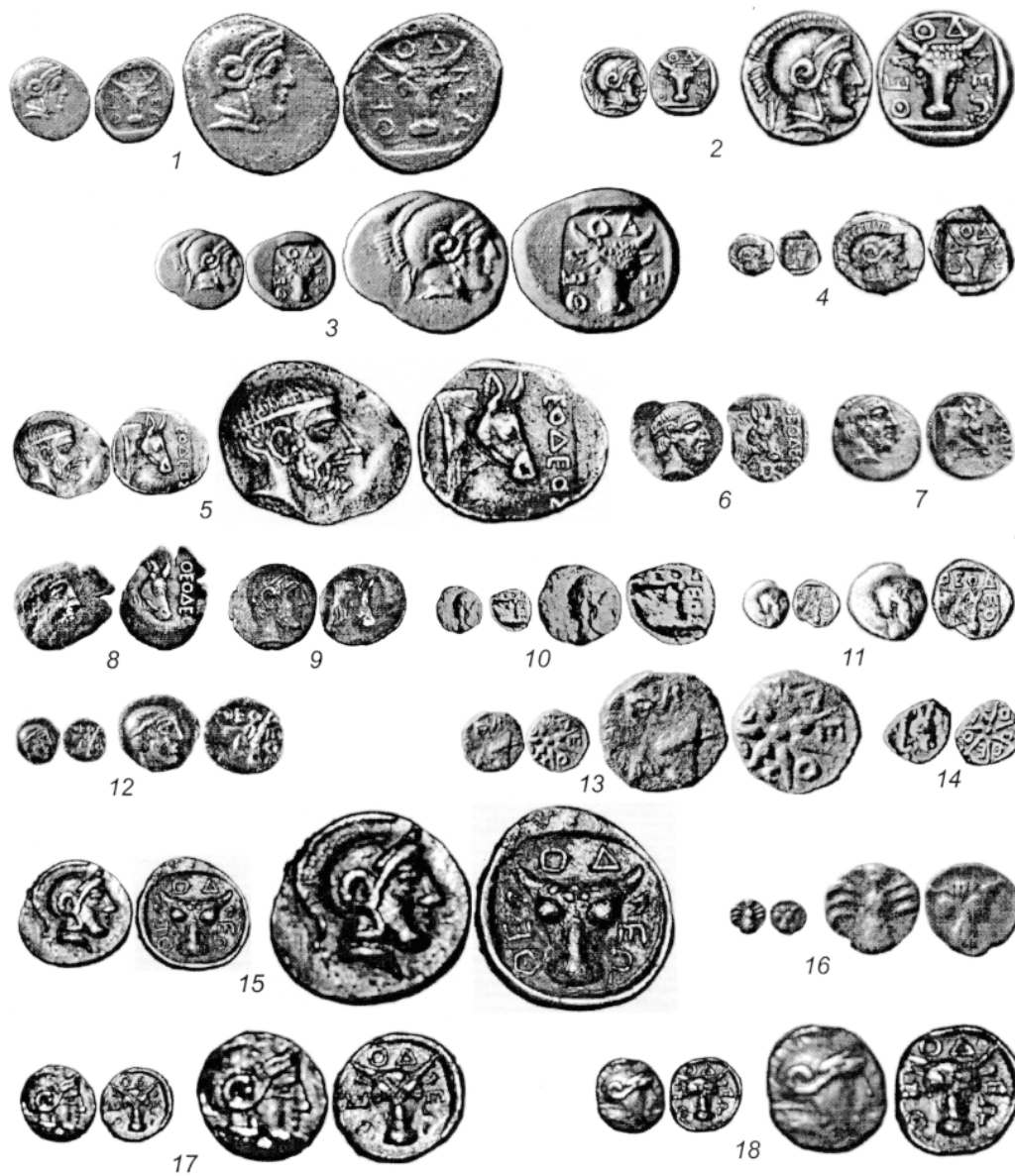
Табл. I. Монеты Феодосии. 1-12, 15-18 - серебряные, 13-14 - медные.