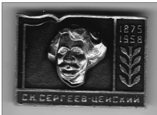
Значок, присвячений С. Сергєєву-Ценському

Пошук та публікація історичних документів є одним з важливих завдань історичної науки. Археографічна робота з оприлюднення та збереження пам'яток минувшини відноситься до числа її стратегічних напрямів. Традиційною складовою спеціальних історичних досліджень є епістолологія (епістолографія), що вивчає приватне листування як окремий вид джерел особового походження [8, с. 228]. Цілком природним є той факт, що