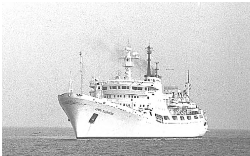
15 ОДС "Адмирал Владимирский"