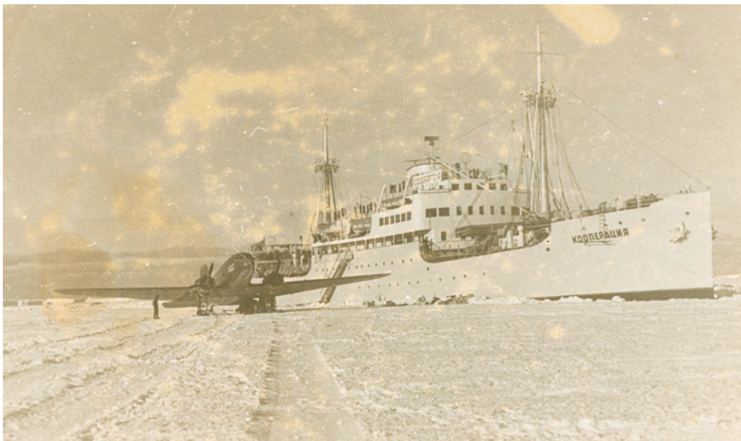
10 Теплоход «Кооперация»