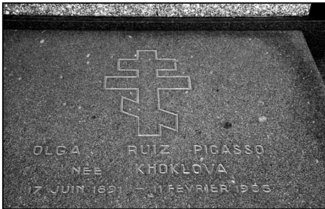
Рис. 8. Надгробок Ольги Хохлової

одягатися та пристойно вів себе в товаристві. Згадуючи потім той період, Пабло стверджував: «То був не я!» Проте на той момент почуття до Ольги Хохлової брали гору. Пікассо, будучи захопленим своєю дружиною, пише здебільшого тільки її портрети.