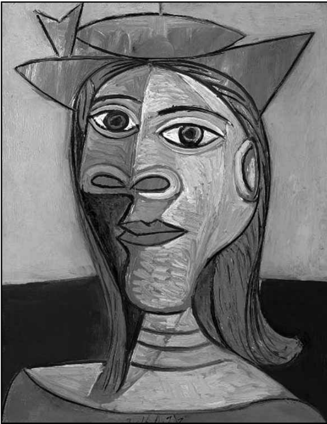
Рис. 6. Портрет Дори Маар пензля Пікассо

народження Степан Васильович Хохлов був у чині поручика, а успішну військову кар'єру зробив та отримав звання полковника набагато пізніше, в 1911 р. [3; 4], коли слава його талановитої доньки вже гриміла театральними підмостками великої імперії.