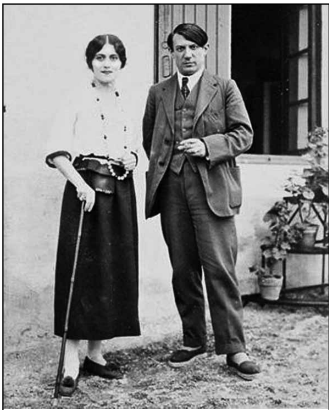
Рис. 3. Хохлова і Пікассо. 1918