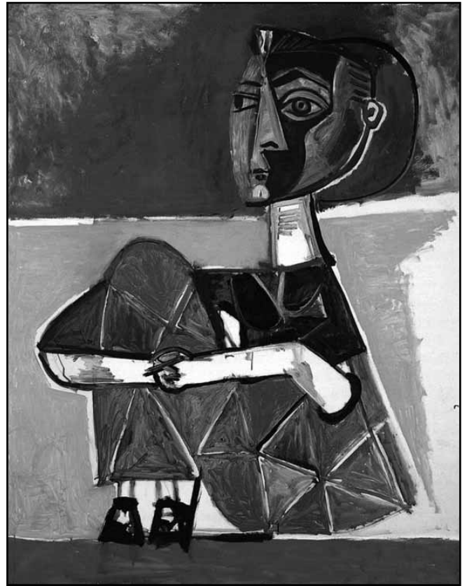
Рис. 7. Портрет Жаклін Рок пензля Пікассо

Вона настільки закохалася в нього, що спочатку почала брати участь у аматорських виставах, а потім і займатися професійно. З 1912 р. вона – балерина зіркової трупи Сергія Дягілева, яка весь час гастролювала у Європі. В цей час на батьківщині Ольги відбулися карколомні події: спочатку світова