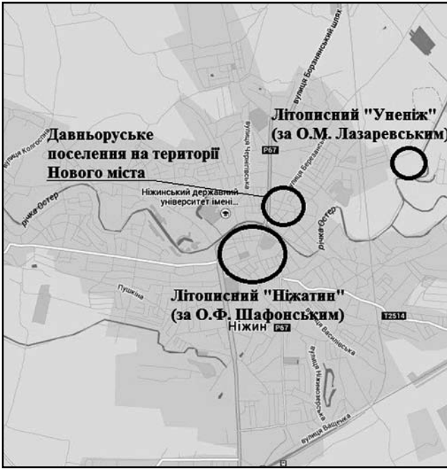
Рис. 2 Схема розташування давньоруських поселень на території м. Ніжина

турного шару якого досягає 0,7 м. Знахідка зазначеного поселення дає підстави говорити про присутність, принаймні, ще одного невеликого населеного пункту на території сучасного Ніжина [7, 15].