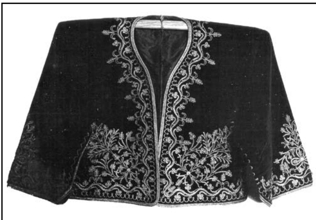
Жіноча кофтина («кирха») з караїмської виставки музею, м. Бахчисарай, 1927–1936 рр. (фотонегатив, КП № 4294/888)

постійно контактували з єдиновірцями з Близького Сходу (зокрема, з караїмськими громадами Дамаску і Багдада), і «часто-густо замовляли там для своїх молитовних домів такі килими» [1, 40]. Ще одним різновидом декоративного шитва було аплікаційне, яке отримало найбільше поширення серед кримських татар-жителів Південного Берега, а також серед караїмів і вірмен Криму. Ця техніка застосовувалася для вироблення килимів, якими покривали стіни кімнат, підлоги в караїмських молитовних будинках «кенасах» [1, 42]. Орнаментальне шитво «пул» (при цій техніці металеві блискітки срібла або золота