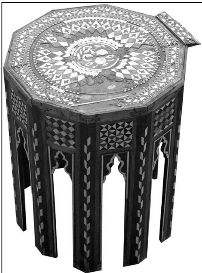
«Курсю» (вид збоку)