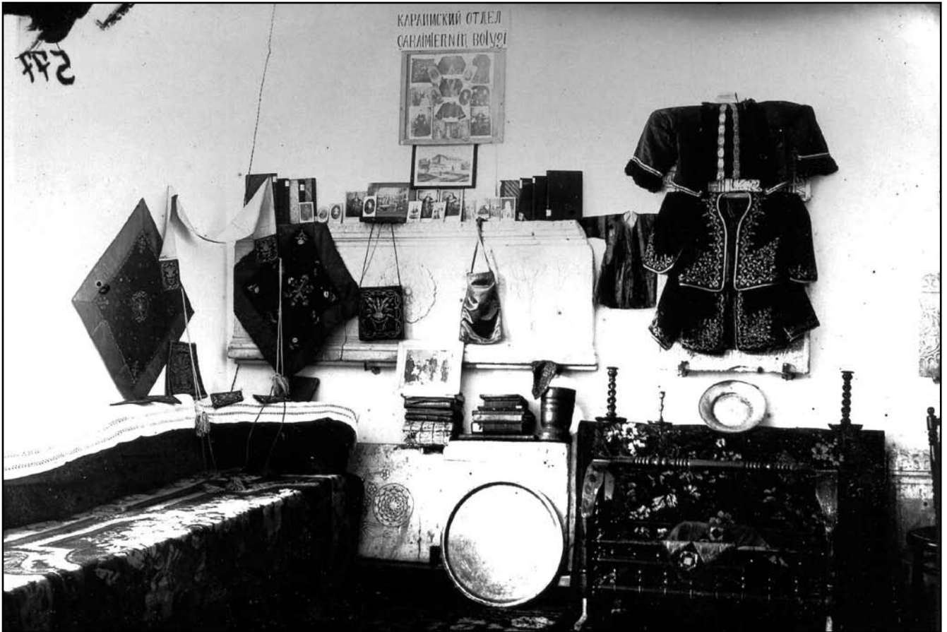
Интер'єр «Караїмської кімнати» музею, м. Бахчисарай, 1927–1936 рр. (фотонегатив, КП № 4293/887)