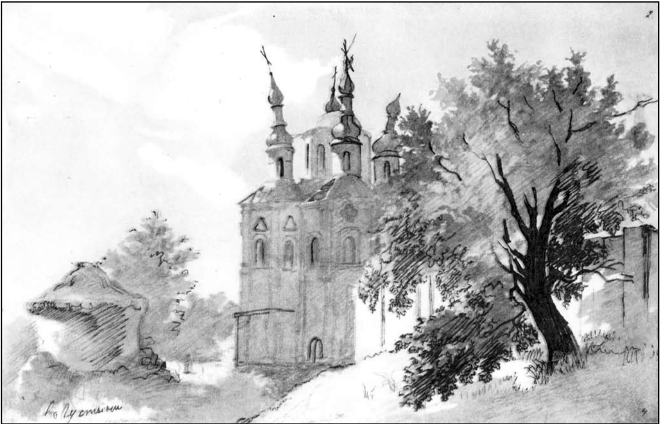
Т. Шевченко. В Густині. Церква Петра і Павла. Акварель. 1845 р.

Може, часеш оновлення? Не жди тії слави! Твої люде окрадені, А панам лукавим... Нащо здалась козацькая Великая слава?!» [4, 365–366].