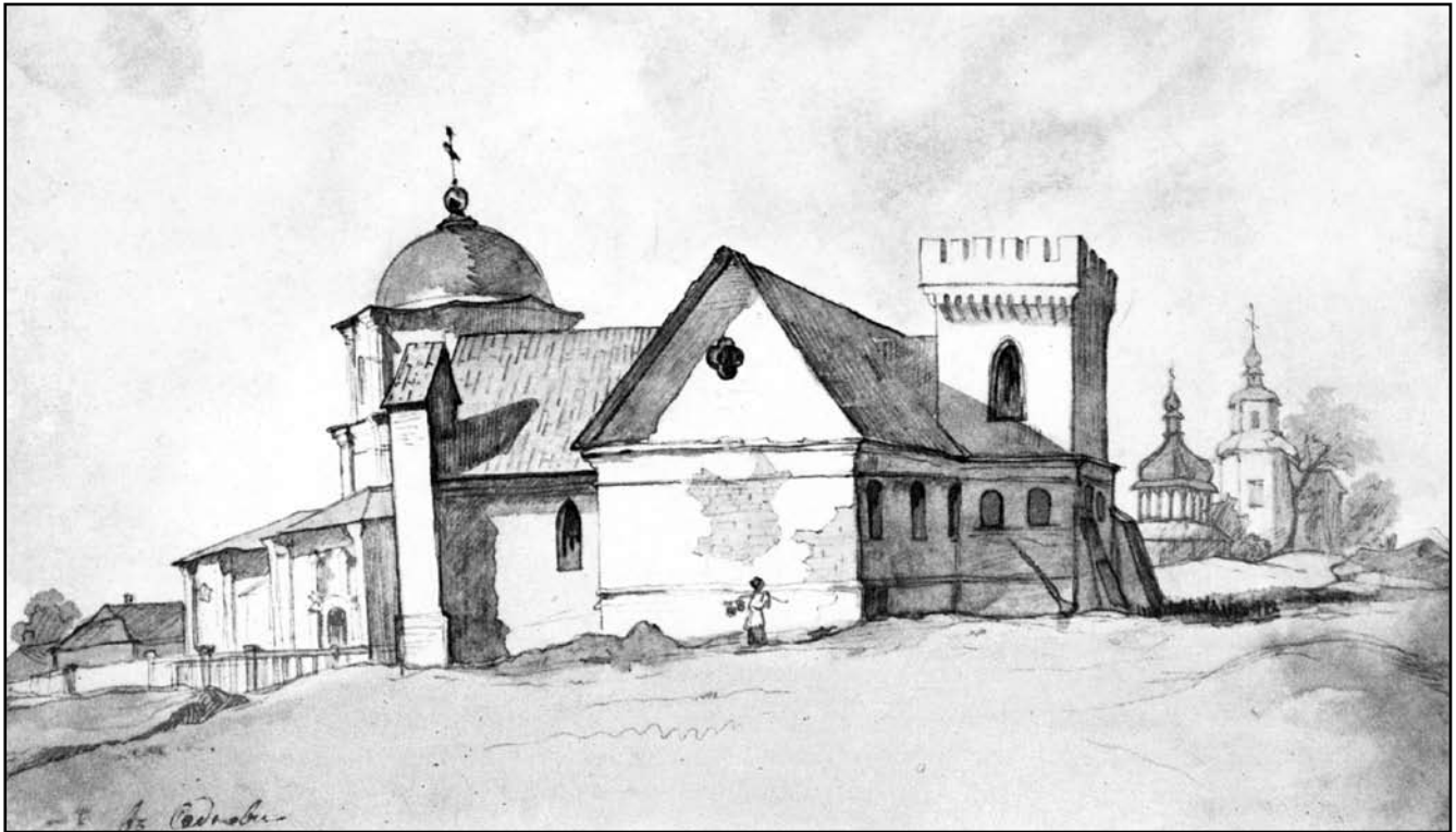
Т. Шевченко. В Седневі. Сепія. 1846 р.