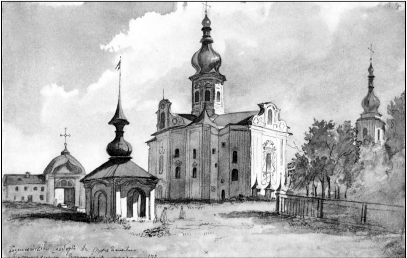
Т. Шевченко. Вознесенський собор в Переяславі. Акварель. 1845 р.