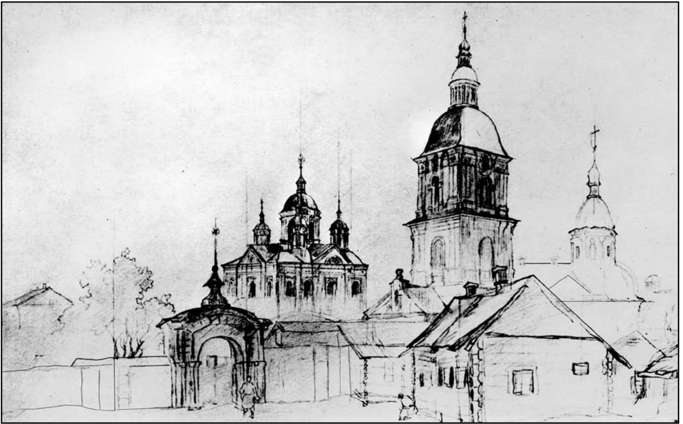
Т. Шевченко. Києво-Межигірський монастир. Олівець. 1843 р.

Розумний батьку!.. і в смердячій Жидівській хаті б похмеливсь Або в калюжі утопивсь, В багні свинячім» (написано 18 авг. 1859 р. у Переяславі) [4, 623].